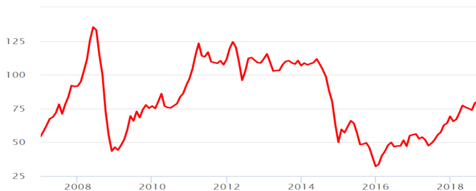
Рис. 2. Динамика цен на фьючерсный контракт на нефть Brent (MOEX, USD за баррель).

Что касается 2018 года, то прогнозы экспертов как на рост объёма ВВП, так и на динамику цен на нефть достаточно оптимистичны. По данным Росстата, ВВП в январе-июле 2018 г. составил 7,6 трлн руб. и вырос (в действующих ценах) относительно того же периода 2017 г. на 34,7%, или почти на 2 трлн руб. Причиной столь значительного расширения можно назвать рост цен на нефть как на мировом рынке (средняя цена нефти марки Urals за данный период выросла на 36,5% год к году), так и на внутреннем (рост на 36,9% г/г).