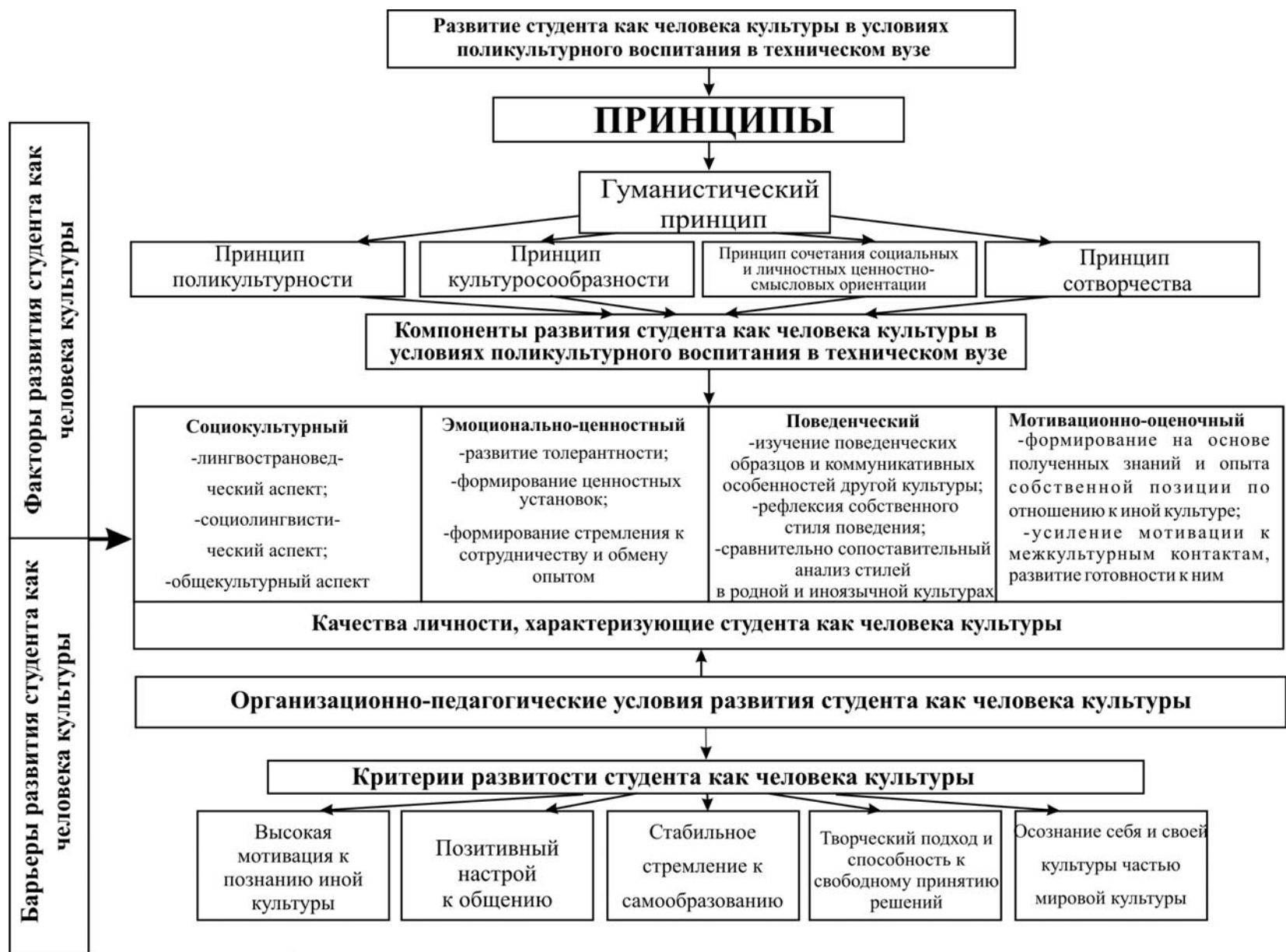
Рис.1. Модель развития студента как человека культуры в условиях поликультурного воспитания в техническом вузе