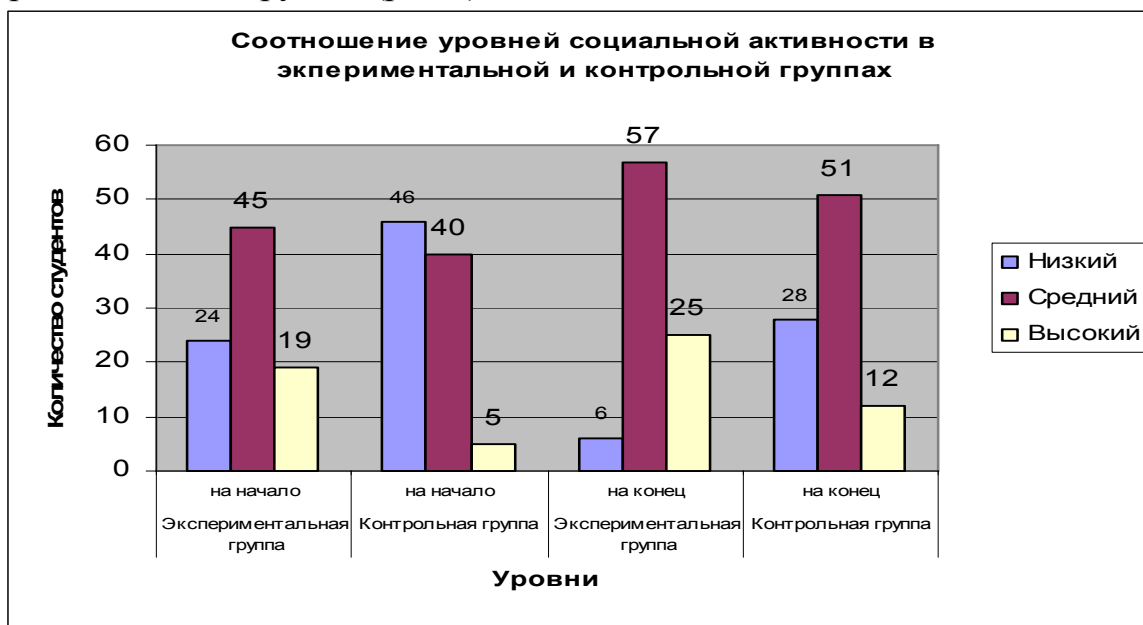
Рис. 2. Соотношение уровней социальной активности в экспериментальной и контрольной группах

Анализ происходящих с участниками эксперимента изменений согласно произведенной самооценке позволил подтвердить повышение уровня проявляемой ими социальной активности. До начала эксперимента согласно самооценке (оценке) низкий уровень социальной активности был выявлен у 24 (27 %) - (10) студентов, средний уровень показали 45 (51 %) - (54) студентов, высоким уровнем социальной активности обладают 19 (22 %) - (24) студентов экспериментальной группы. Анализ средних оценок на начало эксперимента и дисперсий показал их статистически равными для \alpha=0.2 , что указывает на однородность выборок на начало эксперимента, следовательно, различия в показателях на конец эксперимента можно считать воздействием исследуемого фактора – данной методики. В результате интеграции в учебно-воспитательный процесс интерактивных технологий с целью стимулирования социальной активности обучаемых низкий уровень наблюдался у 6 (7 %) – (4) студентов от общего числа, средний уровень показали 57 (65 %) – (58) студентов, высокого уровня социальной активности достигли 25 (28 %) - (26) студентов экспериментальной группы (рис.2).