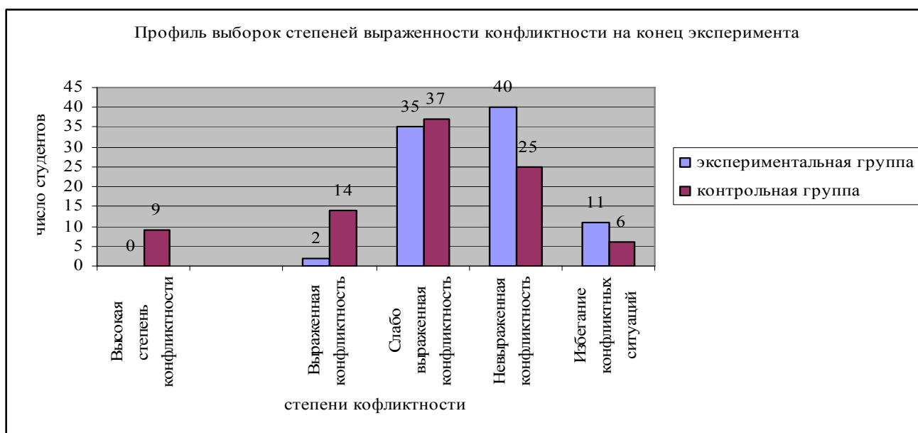
Рис. 3. Профиль выборок степеней выраженности конфликтности

Для изучения конфликтов и причин их возникновения мы обратились к тесту «Самооценка конфликтности», который осуществляет критериальную самооценку степени склонности к конфликтам у испытуемых. По результатам данного теста было выявлено, что основная масса тестируемых экспериментальной группы обладает слабо выраженной конфликтностью. Это означает, что студенты умеют сглаживать конфликты и избегать критических ситуаций. Если же им приходится вступать в спор, они всегда учитывают, как это может отразиться на их взаимоотношениях с окружающими (рис.3).