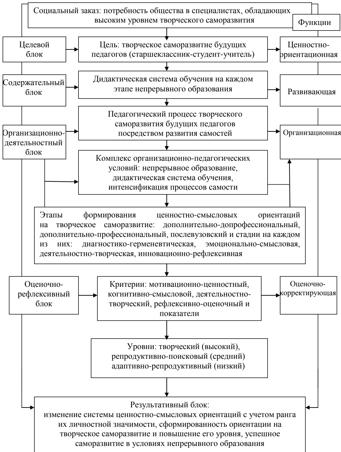
Рис. 1. Структурно-функциональная модель формирования ценностно-смысловых ориентаций будущих педагогов на творческое саморазвитие в условиях непрерывного образования

самосовершенствование, самокоррекция, самопозиционирование), проектируемыми посредством «Я-концепции творческого саморазвития».