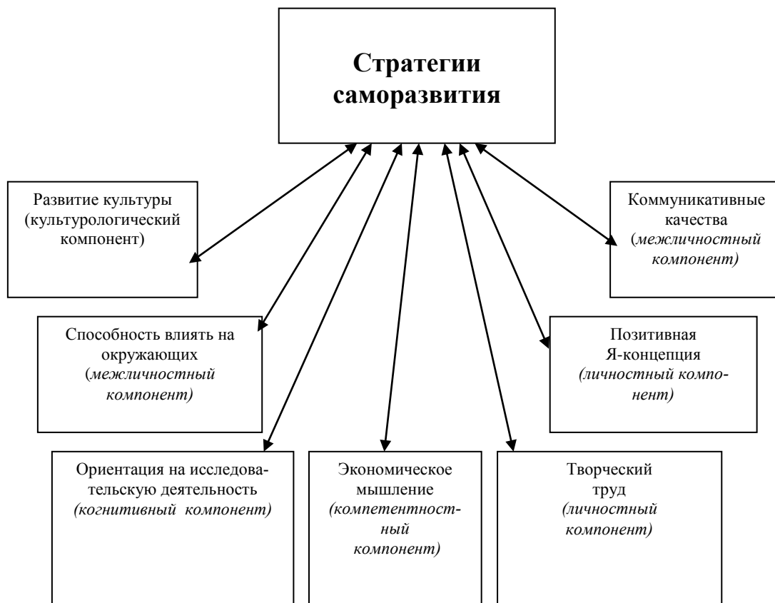
Схема 1. Стратегии саморазвития экономической культуры обучающихся

2) апробация современных образовательных технологий формирования экономической культуры с целью выявления их эффективности: кейс - стадии (обучение с применением конкретных производственных ситуаций, решение ситуационных профессиональных задач), самостоятельная работа на опережающей основе, деловые игры (ее обязательными элементами служат: дидактическая задача, моделирование процесса труда, наличие ролей, различие ролевых целей, игровая конфликтная ситуация, правила игры, состязательность в игре), тренинг, побуждение обучающихся к рефлексии ( анкета- рефлексия, анализ собственной деятельности, ответ на вопрос, побуждающий к рефлексии, оценка обучающимся собственного состояния в процессе работы, самооценка).