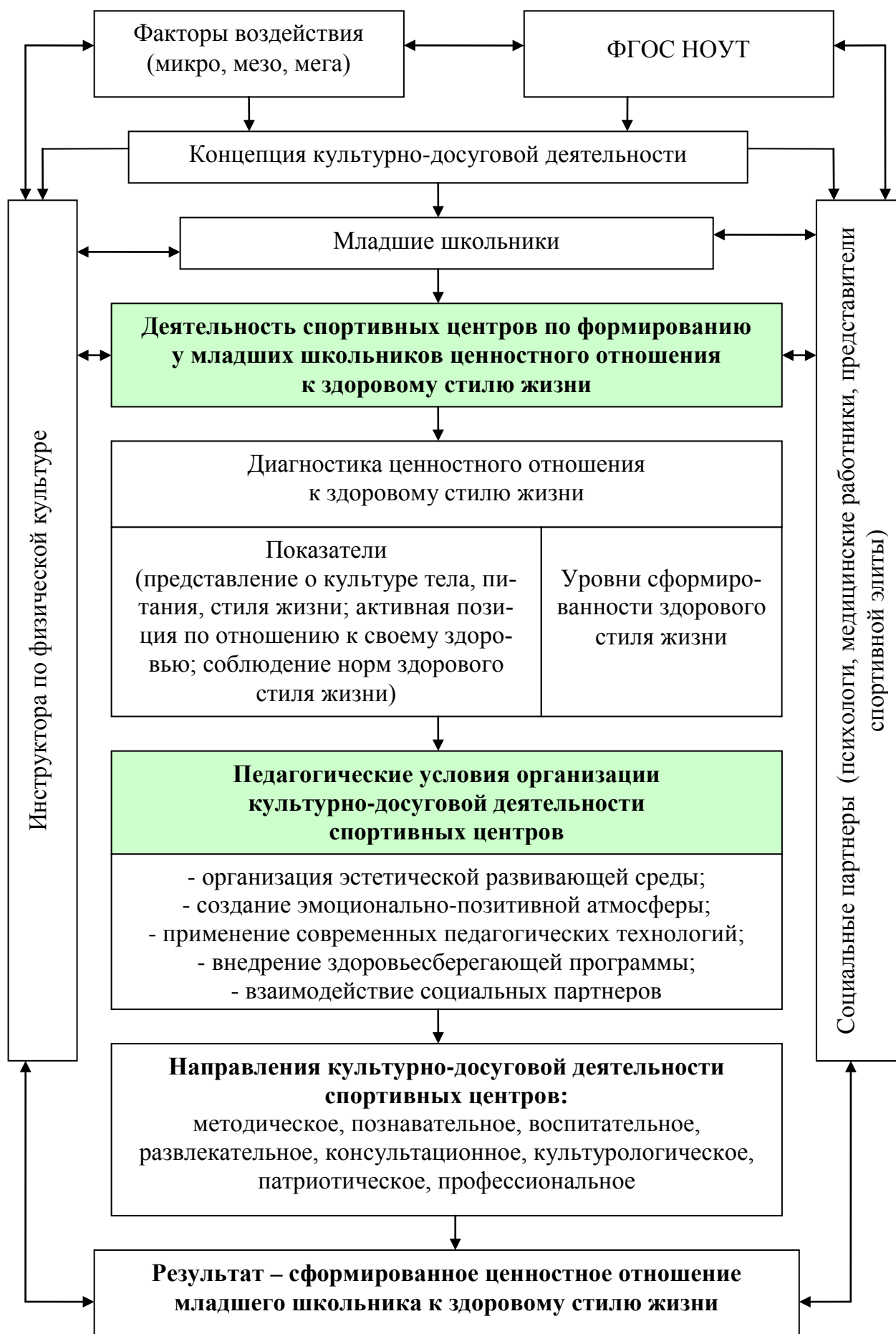
Рис. 1. Модель организации культурно-досуговой деятельности спортивных центров по формированию ценностного отношения к здоровому стилю жизни у младших школьников