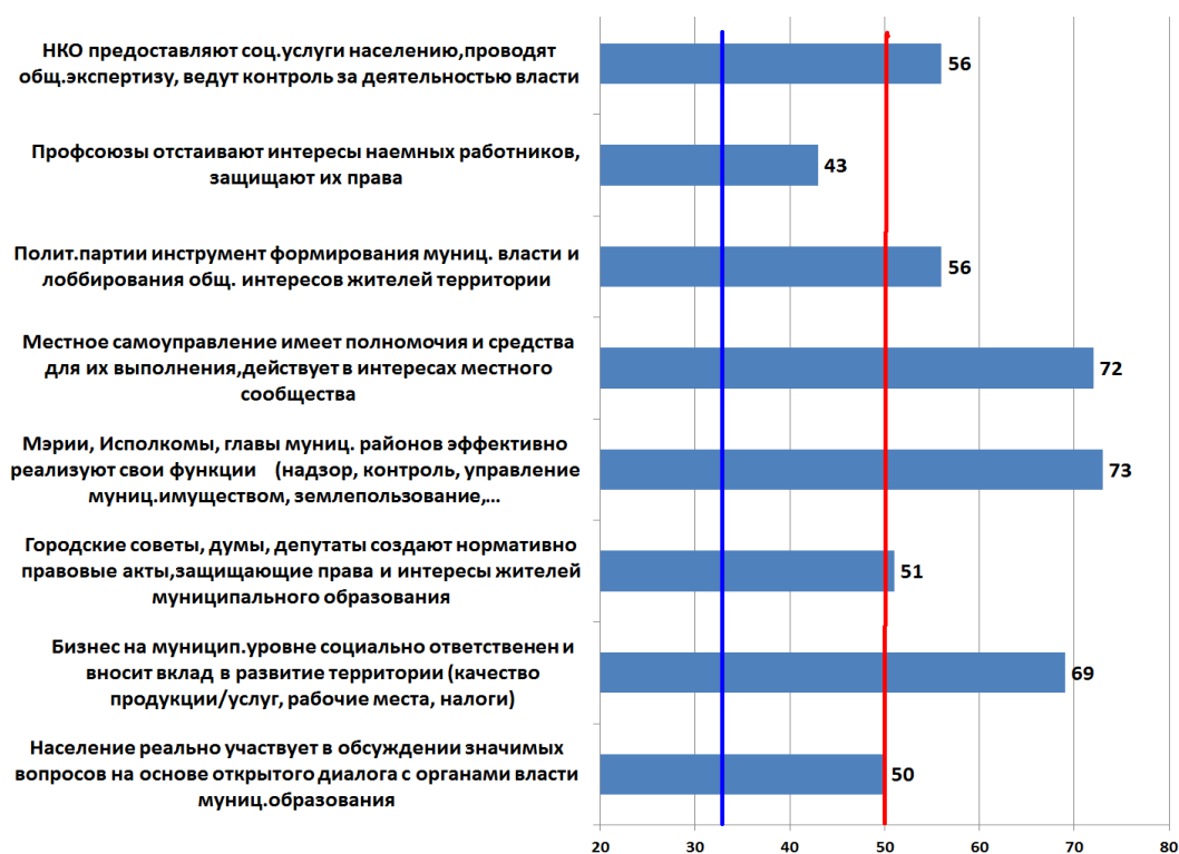
Рис.4. Оценка функциональности субъектов и акторов ПП, Казань

По критерию полноты субъектного функционала, как видно из рис. 4, в зону слабой состоятельности попали профсоюзы, на границе высокой–средней зоны оказалось само население, и чуть перевалил за эту границу депутатский корпус Гордумы. Это говорит о том, что субъектный срез публичной политики в столице РТ находится в достаточно неплохом состоянии. У гражданского общества высокие ожидания и растущий запрос на публичность городского управления: «Моя основная рекомендация – власть должна опираться на гражданский сектор. Причем всегда должна быть оппозиция, альтернативная точка зрения. К ней надо прислушиваться. Не говорим о неадекватных людях. Но есть политики, гражданские активисты, которые говорят разумные вещи. Если будет одна прилизанная точка зрения, власть никогда не узнает о проблемах. У нас такое есть. Есть организации, которые привлекают к проблемам, порой они стихийно возникают, но их нужно всех поддерживать, материально, финансово, что бы они могли существовать» (материалы Фокус–группы в Казани).