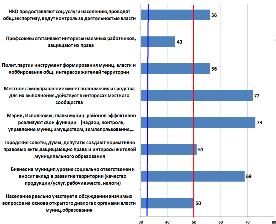
Рис. 1. Функциональность субъектов и акторов ПП. Альметьевск

Как видно из данных, лишь профсоюзы попали в категорию акторов публичной политики, реализация функционала которых в отношении защиты прав наемных работников оценена ниже среднего. Заметим также, что реальность участия самого населения в обсуждении социально-экономических вопросов в диалоге с властью попала на границу между средней и высокой функциональностью.