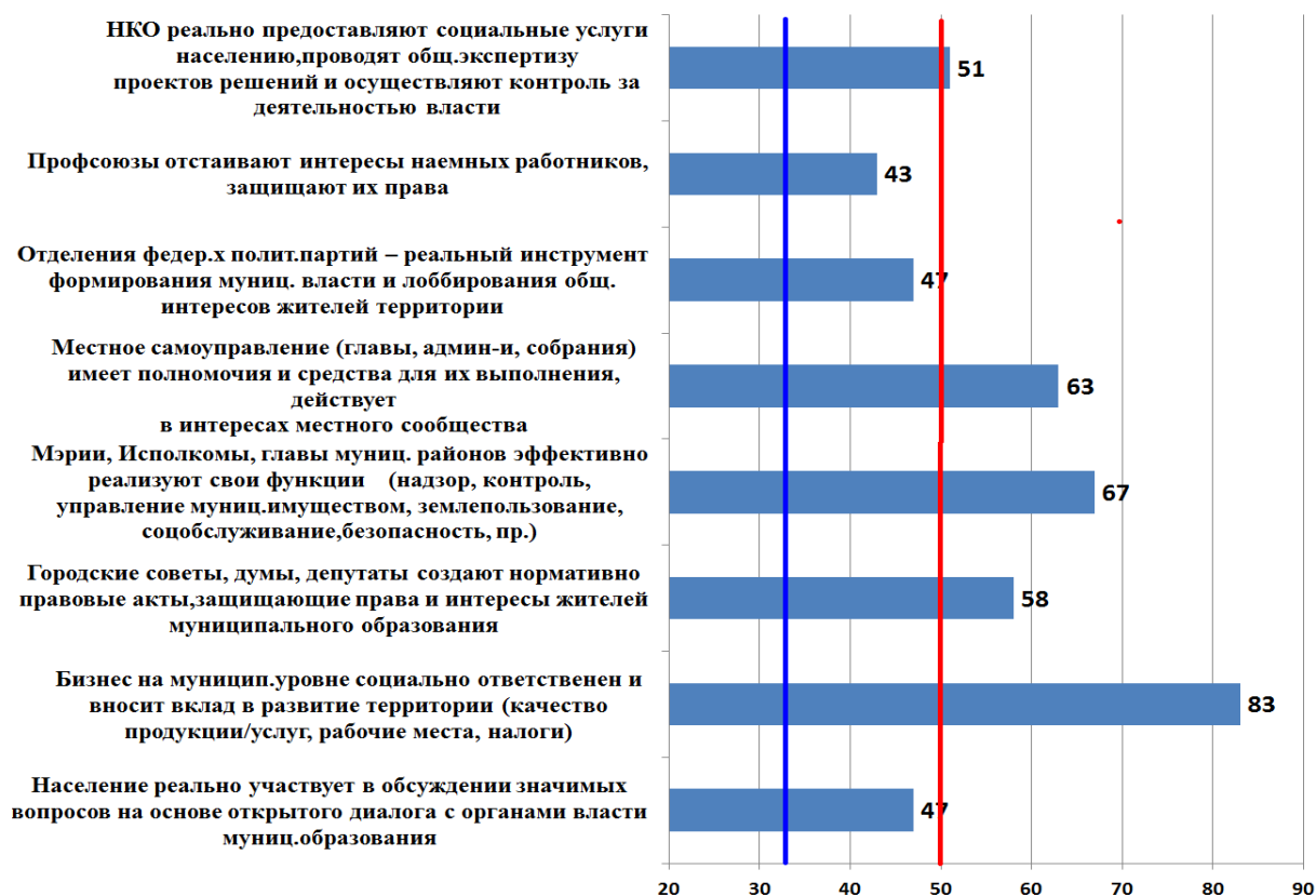
Рис.3. Функциональность субъектов и акторов ПП. Нижнекамск

Интересно выглядит «индексный портрет» состояния публичной политики Казани. НКО и бизнес консолидировались около средних индексных значений (но в партнерском квадранте), а власть оторвалась от них с более высокими значениями в этом же квадранте. Это свидетельствует о наличии некоторых разрывных моментах в системе взаимных оценок и ожиданий всех акторов публичного взаимодействия: власть большего ждет от деловой и гражданской инициативы, задает им более высокие планки задач, а представители гражданского общества считают, что они достойны больших ресурсов для деятельности и большей поддержки своей активности: «Власть должна опираться на гражданский сектор. Пусть в нем будет 10% оппозиции, но поддерживать надо всех, тогда и они будут поддерживать власть. Пока этого не делают, и это неправильно» (материалы Фокус–группы).