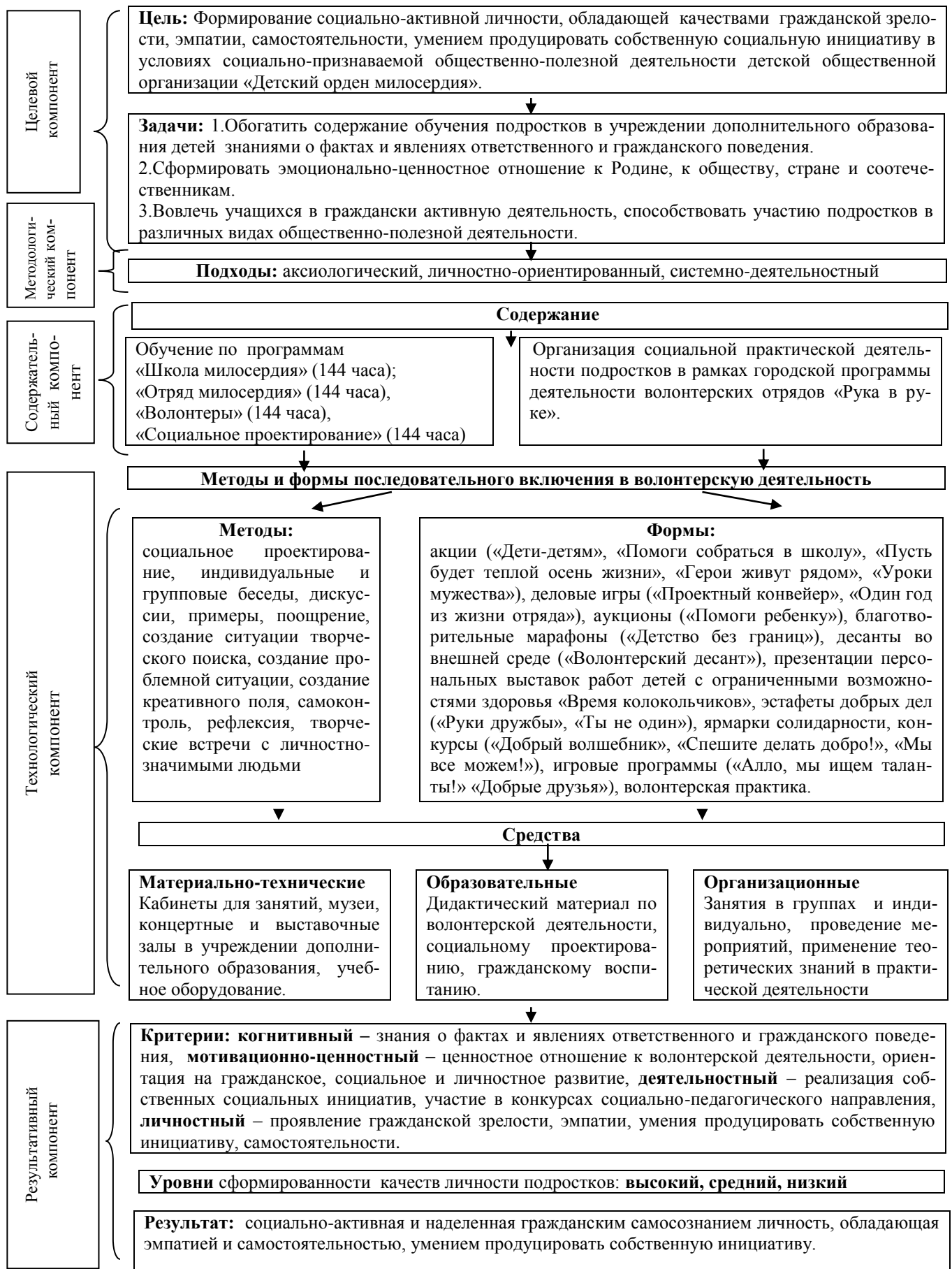
Рис. 1. Модель формирования гражданской ответственности подростков в процессе волонтерской деятельности