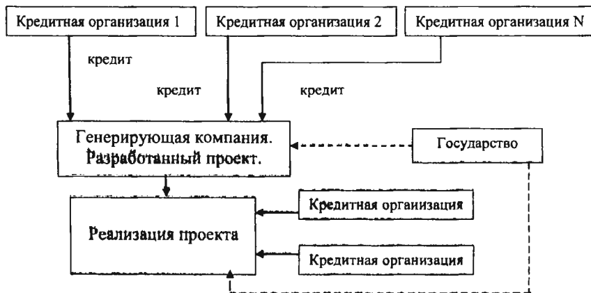
Рисунок 1. Движение денежных средств от кредитной организации к генерирующей компании

Кредитные организации передают средства генерирующей компании под реализацию проекта, а государство является регулирующей организацией на данном этапе (рисунок 1).