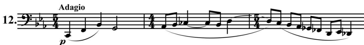
Нотный пример 12. Г. Чеботарян «У памятника старины»

В пьесе «У памятника старины» остиная тема пассакаля, изложенная одногласно, является символом исторического памятника, которыми так богата Армения (Нотный пример 12).