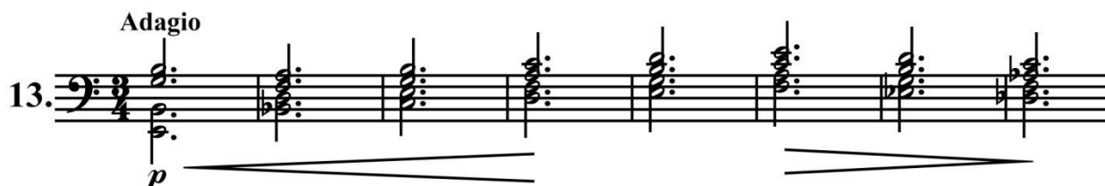
Нотный пример 13. Г. Чеботарян «Неотвязная мысль»

Неспокойным по характеру людям, которые находятся в постоянных поисках, часто преследуют мысли, от которых они никак не могут избавиться даже во время сна. Образ такого человека вырисовывается в пьесе «Неотвязная мысль» (чакона, Нотный пример 13).