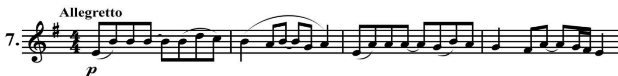
Нотный пример 7. «Народная», тема фуги

Композитор в пьесе «Народная» для фуги, сложной и совершенной формы полифонической музыки, выбрала мелодию народной песни «Назан яр» («Грაციозная любимая», в обработке Т. Алтуняна). Тема звучит в среднем голосе спокойно, нежно, а синкопированный ритм подчёркивает танцевальность народной мелодии (Нотный пример 7).