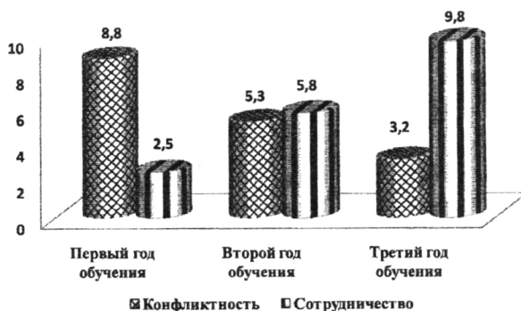
Рис. 1. Динамика развития поведенческих качеств детей младшего школьного возраста в течение трех лет обучения

замерялись такие показатели, как: воспитание нравственных чувств; воспитание нравственного поведения; воспитание нравственного сознания. Опрос проводился в форме анкетирования. Было разработано два вида анкет: для детей и их родителей. В конце каждого года обучения дети и их родители отвечали на ряд вопросов, ответы на которые в обобщенном виде давали представление о динамике формирования нравственных качеств и эффективности программы. В итоге трехлетней реализации экспериментальной образовательной программы показатели ее эффективности значительно возросли. Что касается поведенческих качеств, то за три года конфликтность уменьшилась почти в 3 раза, а сотрудничество возросло почти в 4 раза (Рис. №1). Как показал проведенный анализ детских анкет, развитие художественно-эстетического вкуса, базирующего на способности оценить драматургический материал, поступки и явления действительности с нравственной позиции на начальном этапе было минимальным, а по окончании трех лет формирующего этапа дети достигали заметно лучших результатов (Рис. № 2). Развитие театральные способности отслеживалось по таким показателям, как: творческое воображение; эмоциональная память; эстетическая эмпатия; наблюдательность; восприятие драматического произведения; способность действовать в предлагаемых обстоятельствах (Рис. № 3).