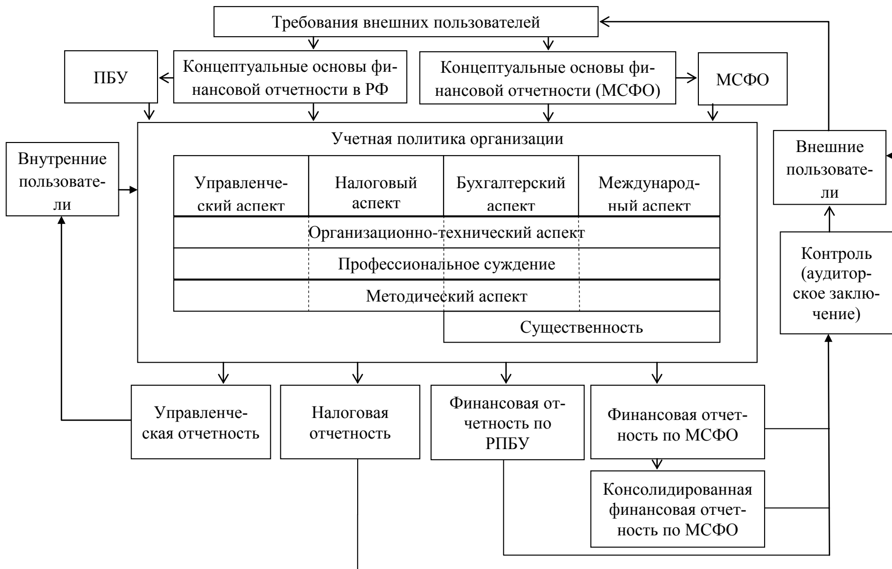
Рис. 2. Предлагаемая модель учетной политики российской организации, составляющей отчетность по МСФО.