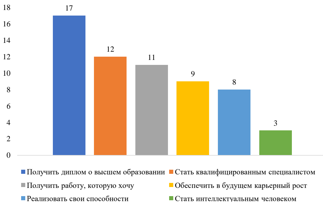
Рис. 1. Цели студентов относительно учебы в вузе