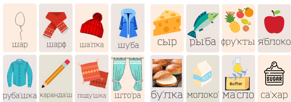
Рис. 1. Лексические карточки уровня А1

В данной статье мы обратим внимание на один из методических приемов, который приобретает все большую популярность среди преподавателей РКИ – использование лексических карточек. Лексические карточки представляют собой эффективное и практичное средство обучения, позволяющее студентам систематизировать и активизировать свой словарный запас (рис. 1) [Сухорукова, 2011]. Мы рассмотрим методику создания и использования лексических карточек, ее преимущества и практическое применение на занятиях по изучению русского языка как иностранного.