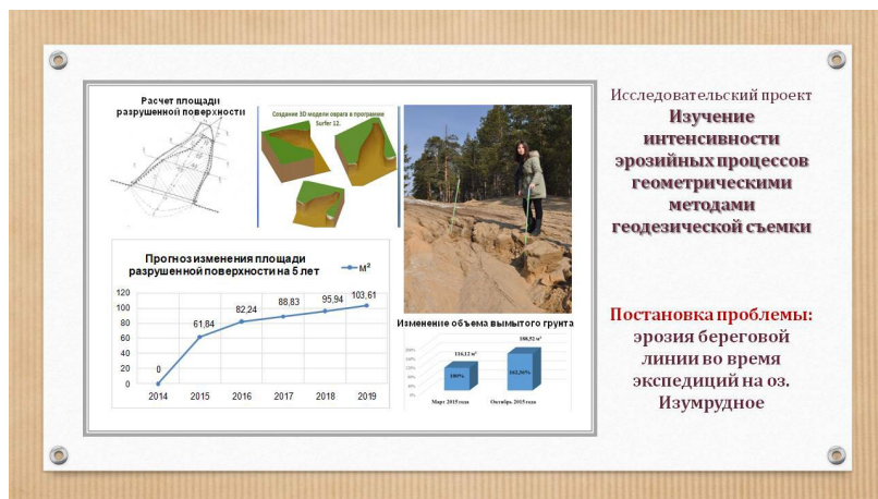
Рис. 1. Исследовательский проект «Исследование интенсивности эрозионных процессов геометрическими методами геодезической съемки»

Сейчас во всех наших проектах, связанных с проведением геодезических исследований, ребята используют данные технологии, моделируя исследуемые объекты в динамике. Так для исследования интенсивности эрозионных процессов проводились измерительные работы на местности [8]. В ходе исследования дважды была проведена геодезическая съемка. Были представлены чертежи, планы, расчеты с учетом весенней и осенней съемок. Для определения площади поперечных сечений и общей площади разрушенной поверхности почвы мы перенесли исследуемый участок на план. Используя полученные нами данные, мы определили объемы вымытого грунта. Создана 3D-модель оврага в программе Surfer 12 (Рисунок 1).