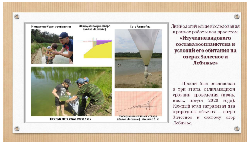
Рис. 3. Исследовательский проект «Изучение видового состава зоопланктона и условий его обитания на озерах Залесное и Лебяжье»

Во время реализации исследовательского проекта «Исследование основных морфометрических характеристик русла реки Илеть на участке ее излучины» (Рисунок 4) обработали, систематизировали и обобщили географическую информацию, полученную в результате экспедиционных исследований. Провели математические расчеты и анализ замеров на точках створов излучины реки Илеть. Также выполнили необходимые математические построения и вычисления (профили поперечных сечений русла в створах, площади поперечных сечений, расход воды). Чтобы нагляднее представить характер поперечного сечения в створах, мы выполнили модели поперечного профиля при помощи 3D- ручки по чертежам в масштабе 1:100. Данные модели позволили нам наиболее полно отобразить картину поперечного сечения русла в пределах параметров излучины реки Илеть [8].