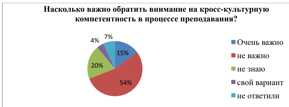
Диаграмма 2. Взгляд на необходимость формирования кросс-культурной компетентности в процессе преподавания в вузе

А) понимание на другом языке (15 %); Б) уважение к культуре, традициям, языку другой страны (54 %); В) умение ладить с представителями других национальностей (20 %); Д) умение вести себя с представителями разных национальностей в соответствии с обычаями этой страны (4 %); Е) не понимаю этого термина (7 %).