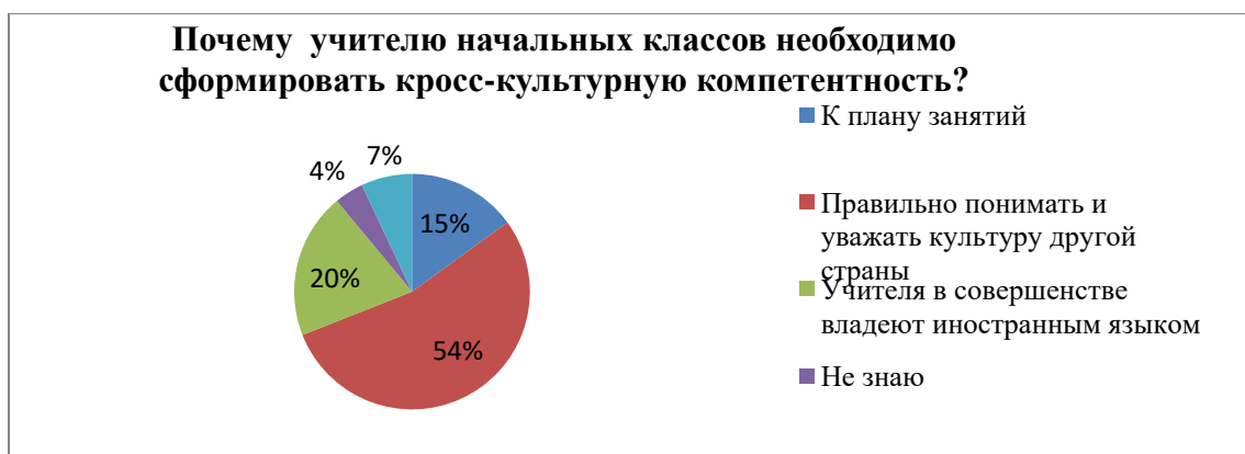
Диаграмма 3. Почему учителю начальных классов необходимо сформировать кросс-культурную компетентность

А) очень важно (15 %); Б) не важно (54 %); В) не знаю (20 %); Д) предложите свой вариант (4 %); Е) не ответили (7 %).