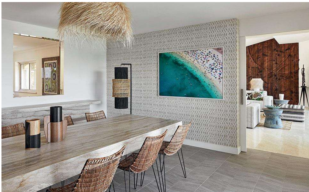
Рис. 2. Столовая

В столовой (рис. 2) предельно лаконичная конструкция мраморного стола создает опять-таки стилевой контраст с рустикальной фактурой винтажных стульев.