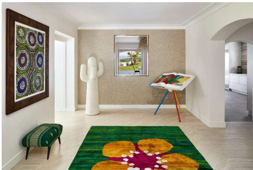
Рис. 3. Входной холл

двойственность: казалось бы, этнический ковер, но выглядит как произведение современного искусства.