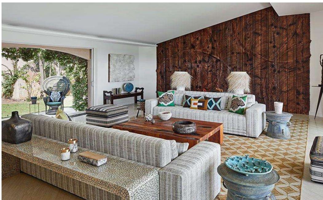
Рис. 1. Гостиная

контраст. Футуризм начинает «звучать» здесь с миниатюрного акцента – бронзовой скульптуры (автор – Альбер Феро (Albert Feraud), 1956) на лавке-консоли и раскрывается «в полный голос» на той же стене объемным панно. Этот арт-объект побуждает наблюдателя не только к зрительным, но и к тактильным ассоциациям, демонстрируя, то ли застывшую пену морского прибоя, то ли ландшафт далекой планеты. В качестве придвинных столиков использованы традиционные тайские барабаны, но выглядят они так, будто их обнаружили спустя десятилетия исследователи из будущего. Безупречно этнофутуристичны настольные лампы: обтекаемое «космическое» основание органично соседствует с узнаваемо-земным, «африканским» абажуром из пальмового волокна.