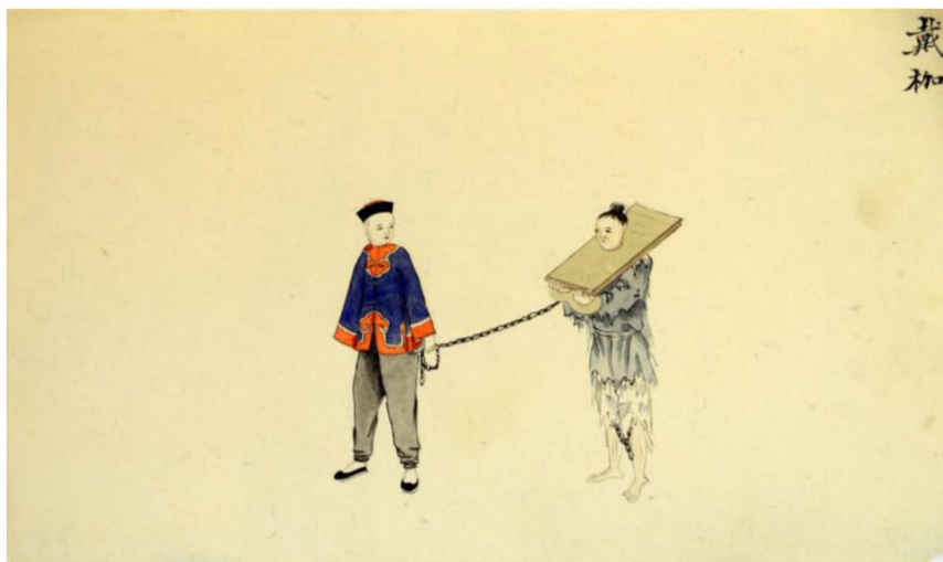
Илл. 3. Наказание колодкой

наказанием считалось ношение деревянной панели с отверстием для шеи (илл. 3). Эта панель, на которой были написаны имя и правонарушение, не только не давала осужденному дотронуться до лица или увидеть свое тело, но и мешала дышать. Отсутствие отдыха отслеживалось судебным исполнителем. Особой жестокостью отмечены листы, демонстрирующие методы смертной казни от удушения или обезглавливания. Во втором случае художник с особой тщательностью изобразил сцену отсеченной от тела головы.