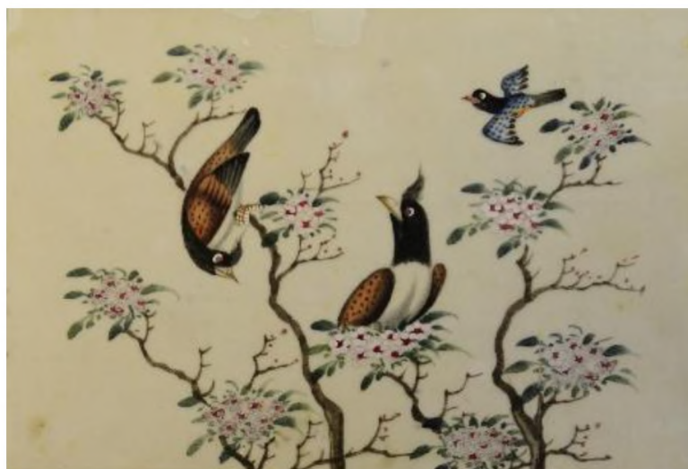
Илл. 5. Цветы и птицы

Характерно, что в наборе картинок из собрания ЕМИИ нет ни одной на тему жизни императорского двора. В альбомах XIX века эта линия была одной из самых распространенных с одной стороны, и с другой – самых разработанных в плане художественных средств. Обычно это были сложные многофигурные композиции, с прописанными фонами и обстановкой, детализацией в изображении костюмов.