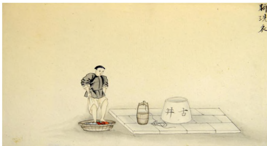
Илл. 1. Стирка белья

Следующая группа листов представляет ритуальные, церемониальные и праздничные сцены. В вытянутом по горизонтали листе представлена церемониальная процессия, представляющая разные сословия. Один из листов представляет традиционный ритуал «встречи весеннего быка» во время празднования Дня прихода весны. Этот ритуал заключался в раздирании живого быка, с течением времени замененного на его глиняное или бумажное изображение (илл. 2).