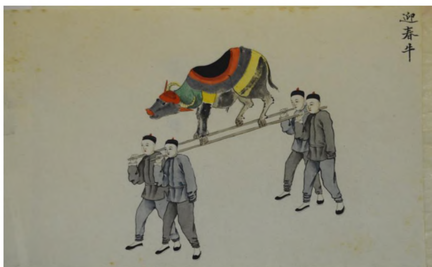
Илл. 2. Встреча весеннего быка

Здесь же мы видим изображение «танца дракона» – традиционного китайского танца, исполняемого с крупной куклой дракона во время крупных торжеств. Три листа в этой группе связаны с отправлением погребального культа и поклонением духам. На одном из листов показан свадебный обряд подношения риса.