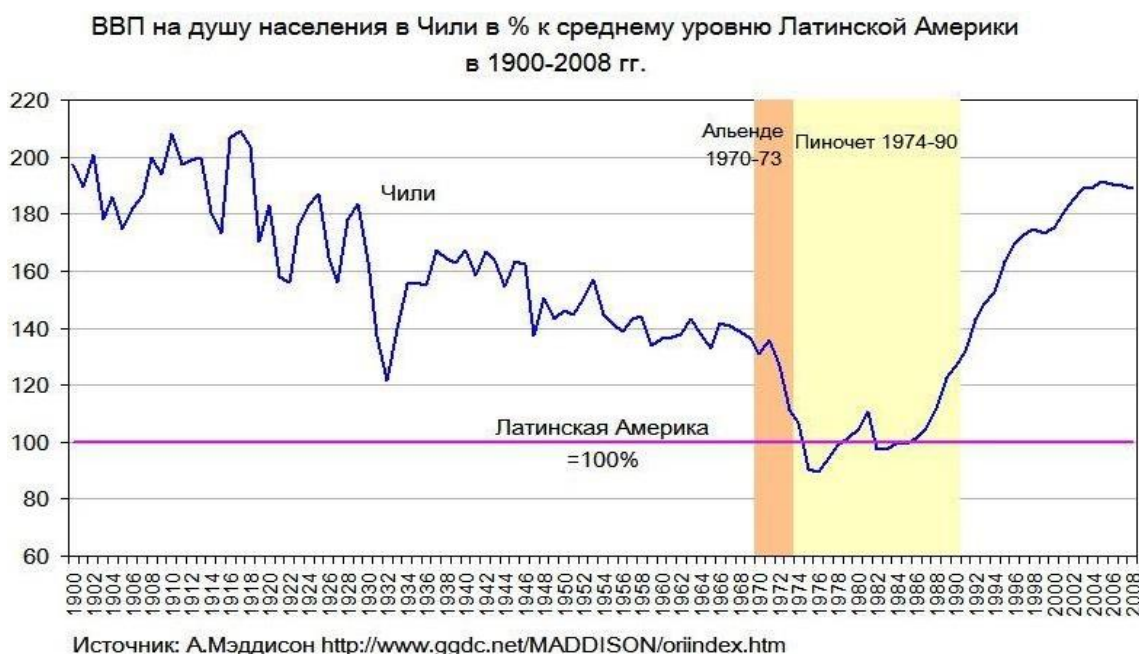
Рис. 1 . Показатели ВВП на душу населения Чили в % к среднему уровню Латинской Америки в период с 1900 по 2008 г.г.

Однако автократия так же может обернуться “неприятным сюрпризом” и вместо благоприятного экономического климата страна может получить сумасброда упивающегося собственной властью, например Жана Бедель Бокасса. которого не волнует ни один из государственных институтов. В таком случае демократия выступает в роли некоего “автопилота”, который скорректирует отклонение от курса, если правитель увлекся своей властью.