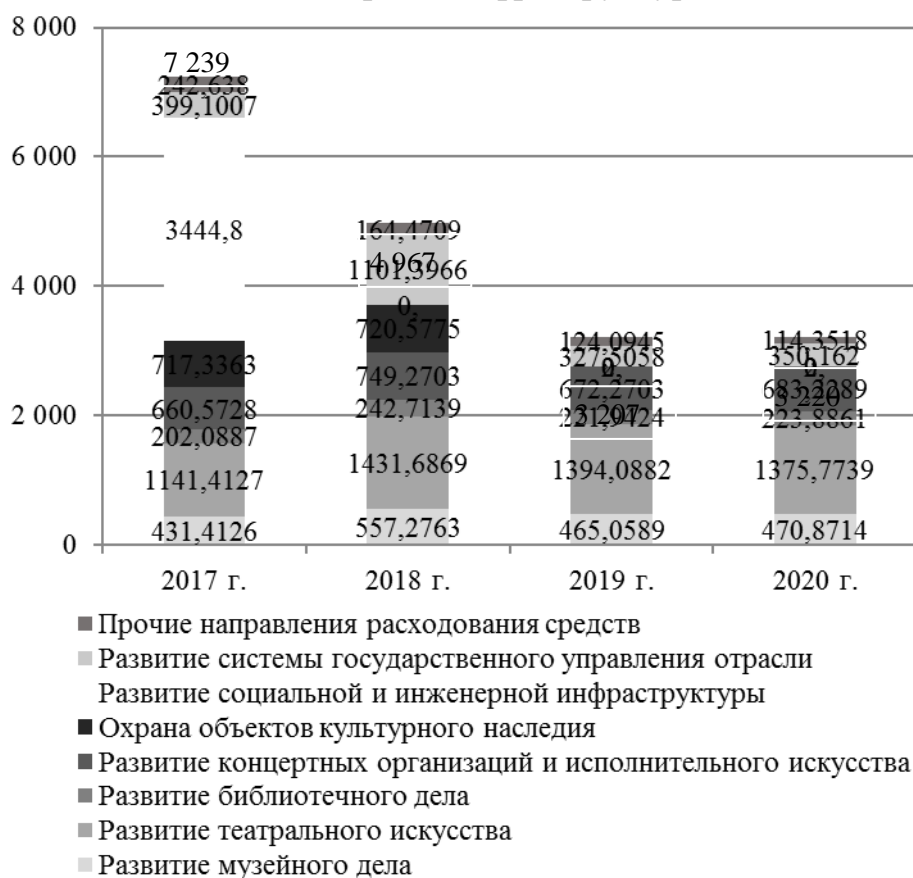
Рис. 2. Структура расходов бюджета Республики Татарстан по подпрограммам государственной программы «Развитие культуры Республики Татарстан на 2014–2020 гг.», млн руб. [4, 5]

Приведенные показатели в целом свидетельствуют о стабильности бюджетных расходов на культуру по таким направлениям как: развитие театрального искусства, развитие музейного дела, развитие библиотечного дела, развитие концертных организаций и исполнительного искусства. Финансирование прочих подпрограмм привязано к реализации тех или иных приоритетных направлений в различные годы. Так, в 2017 г. было выделено 3 445 млн руб. на развитие социальной и инженерной инфраструктуры.