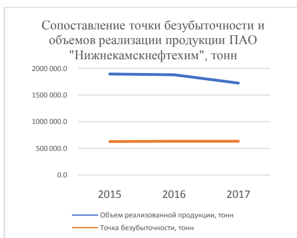
Рис.1. Сопоставление точки безубыточности и объемов реализации продукции ПАО "Нижнекамскнефтехим"

Исходя из данных, представленных на Рисунках 1 и 2, можно прийти к выводу, что деятельность ПАО «Нижнекамскнефтехим» прибыльна, поскольку график точки безубыточности как в натуральном, так и в стоимостном выражении лежит ниже графика объема реализованной продукции и выручки, соответственно.