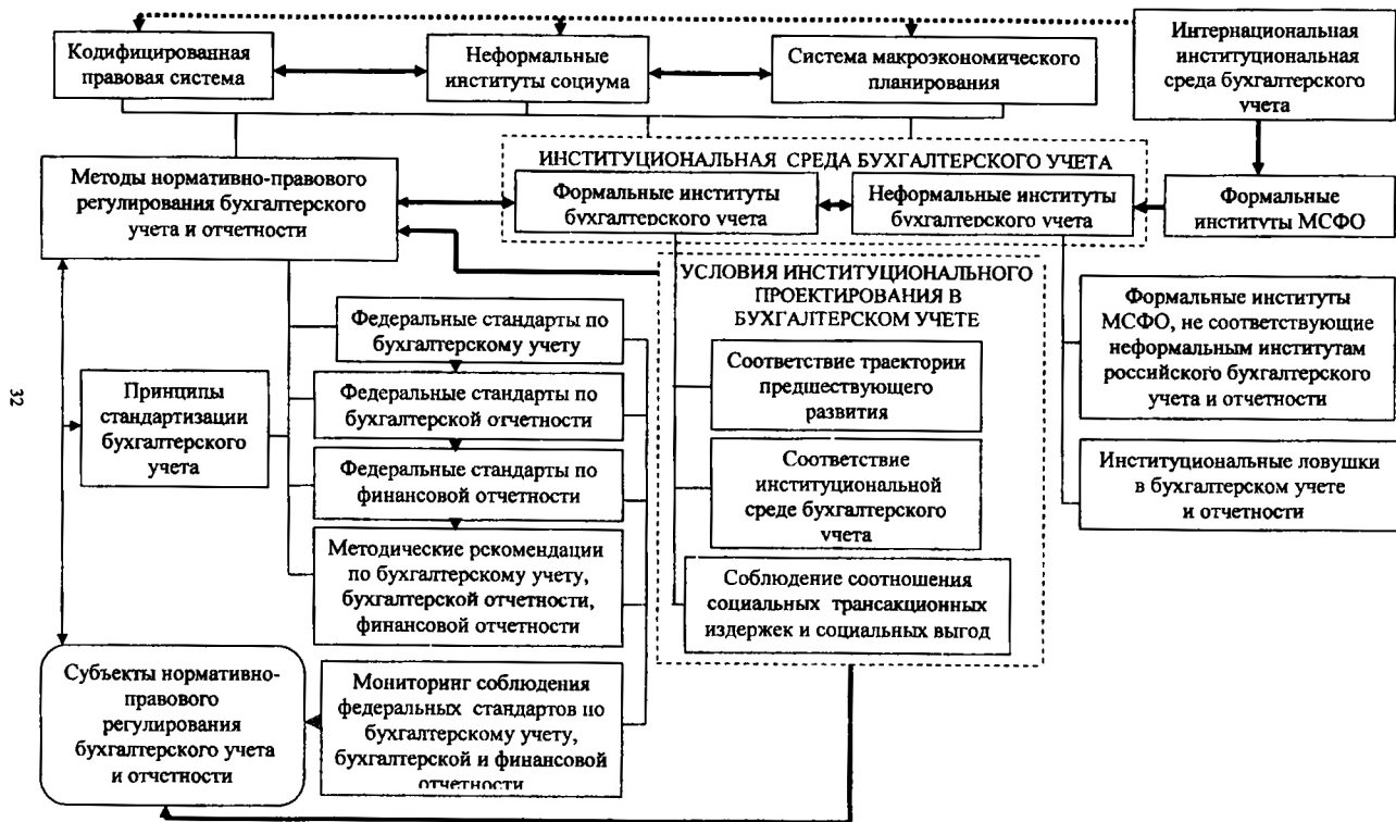
Рис. 3. Принципиальная схема институциональной модели регулирования бухгалтерского учета и отчетности в России