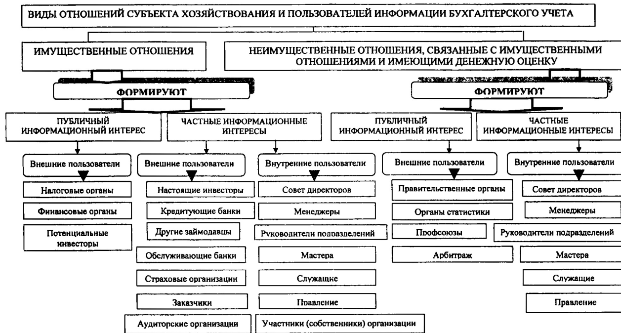
Рис. 2. Авторская классификация пользователей бухгалтерской информации в зависимости от видов отношений с субъектом хозяйствования