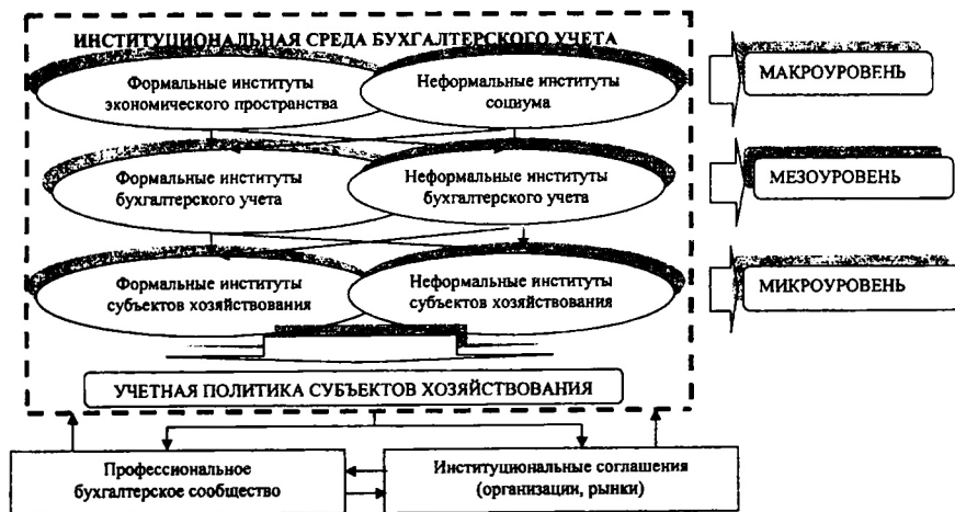
Рис. 1. Институциональная структура бухгалтерского учета

Институциональной теорией установлено: совокупность институтов внутри общности людей составляет институциональную среду, которая трансформируется от всецелого подчинения хозяйственного поведения людей неформальным правилам к созданию формальных правил и нахождению между ними баланса. Отсюда институциональная среда бухгалтерского учета составляет комплекс взаимодействующих формальных и неформальных норм профессионального поведения членов бухгалтерского сообщества. Институциональная структура бухгалтерского учета обусловлена его социальным характером и объединяет институциональную среду бухгалтерского учета и взаимодействующие институциональные соглашения (организации, рынки) (Рис. 1).