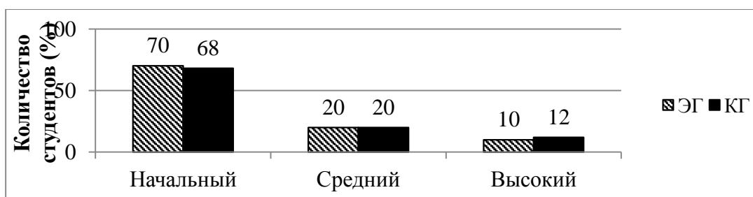
Рис. 1. Результаты сформированности профессиональной компетенции мультикультурной направленности будущих учителей на констатирующем этапе эксперимента

Формирующий этап. Основными задачами этого этапа являлись: внедрение в учебный процесс разработанной специальной педагогической модели развития профессиональной мультикультурной компетенции студентов; формирование у студентов профессионально значимых мультикультурных компетенций на основе предлагаемых технологий; наблюдение за экспериментальными и контрольными группами с целью сопоставления полученных данных. Для проведения этого эксперимента были выбраны разделы специально разработанного образовательного материала, наиболее полно отвечающие целям и задачам экспериментального обучения.