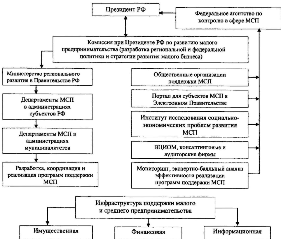
Рис. 3. Модель системы федеральной и региональной поддержки малого предпринимательства в ПФО на макро и мезо-уровнях [авторская разработка]

Структурированы региональные различия в разрезе ПФО, с учетом чего обосновано, что наибольший потенциал для функционирования малого предпринимательства сегодня сконцентрирован в Республике Татарстан, как в инновационной сфере, так и в сфере развития высоких технологий и наукоемких производств (табл. 1) 1 .