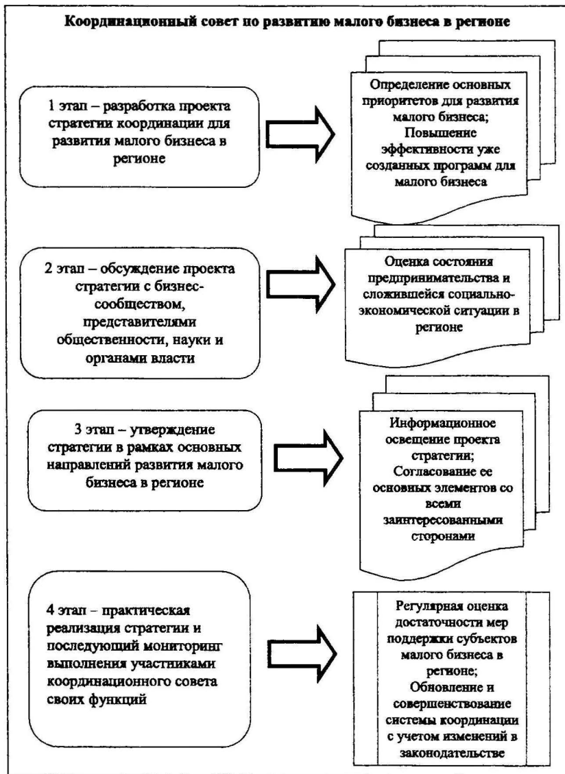
Рис. 4. Алгоритм формирования стратегии координации развития малого предпринимательства на региональном уровне [авторская разработка]

Доказано, что практическое использование стратегии координации позволит существенно сократить разрыв между заявляемыми направлениями поддержки предпринимательства и законодательным регулированием