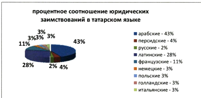
Рис. 2. Процентное соотношение заимствованной юридической лексики в татарском языке

В третьей главе «Структура и словообразование заимствованной юридической лексики в татарском языке» исследуются структурные особенности и способы образования заимствованной юридической лексики. В данной главе рассматривается структура заимствованной юридической лексики, выделяются основные типы, модели словообразования иноязычных юридических терминов, рассматриваются связи компонентов, синтетические и аналитические слова, наиболее частые словообразующие суффиксы юридических заимствований.