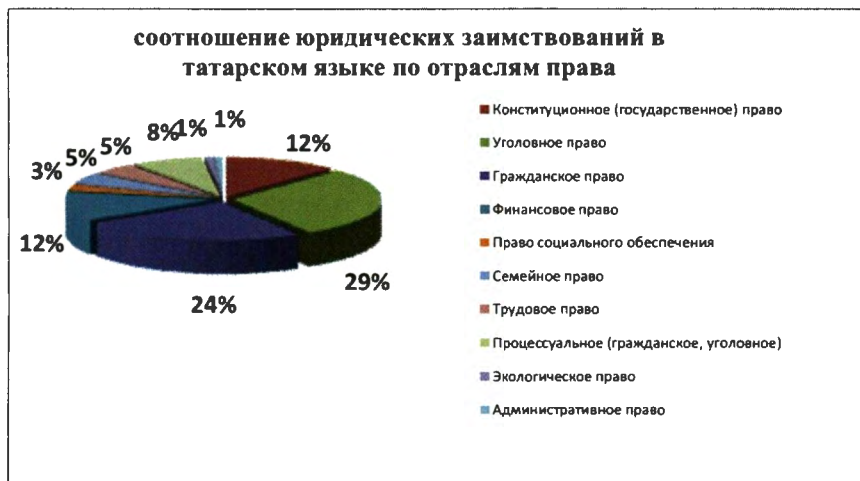
Рис.1. Процентное соотношение заимствованной юридической лексики по отраслям права.

использоваться с одинаковой активностью и функциональной важностью в различных отраслях права ( норма права, хокук, юрисдикция и т.п.), см. рис. 1.