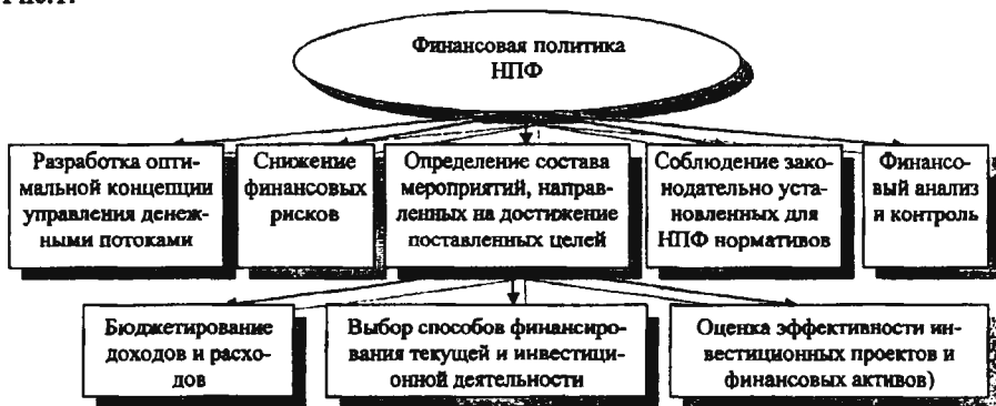
Рис.1. Элементы финансовой политики НПФ

Формирование и использование финансовых ресурсов для реализации стратегических и тактических задач НПФ характеризует такое понятие как финансовая политика. Финансовая политика НПФ призвана решать следующие задачи: усиление позиций на рынке пенсионного страхования; достижение оптимальных показателей деятельности НПФ; увеличение размера пенсионных выплат. Финансовая политика включает в себя ряд элементов, представленных на Рис.1.