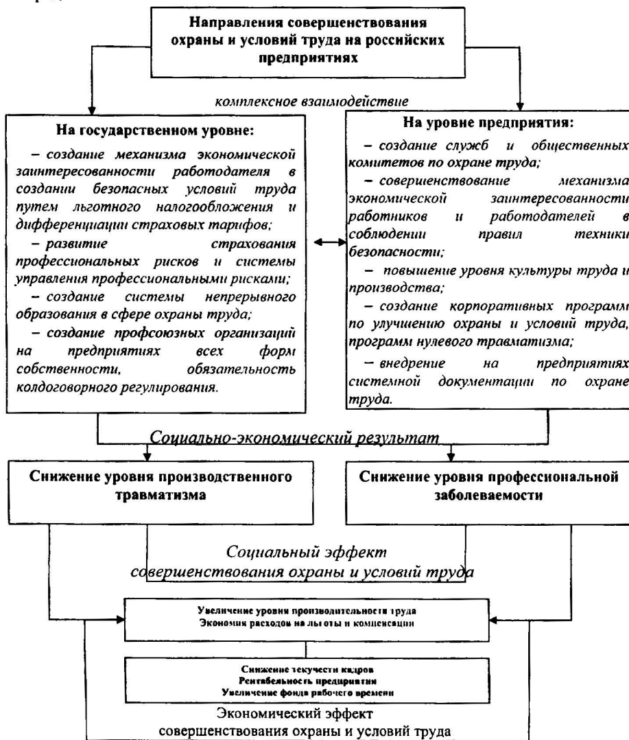
Рис. 5. Направления и результаты совершенствования охраны и условий труда