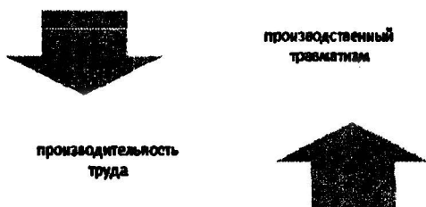
Рис. 4. Взаимосвязь производительности труда и производственного травматизма

На основании расчетов была выявлена тесная связь между двумя переменными: коэффициентом производственного травматизма и уровнем производительности труда (чем ниже уровень производственного травматизма, тем выше производительность труда).