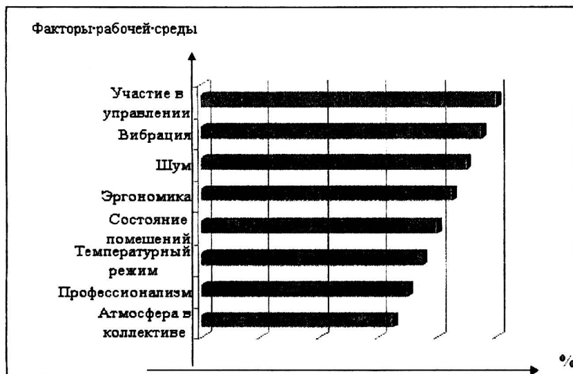
Рис.3. Влияние факторов рабочей среды предприятия ООО «Сторожевское ЛПУМГ» на состояние условий и охраны труда на предприятии, в % от общего числа опрошенных

В анкетировании приняло участие 213 человек. На основании полученных данных было выявлены неудовлетворительные стороны условий труда на предприятии, составлен план работы на 2010 год.