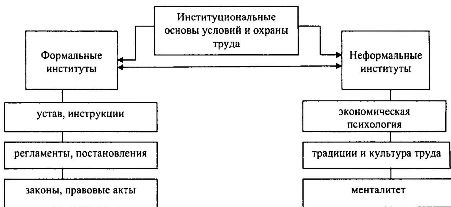
Рис. 2. Институциональные основы условий и охраны труда

Формальные институциональные основы – это механизм, в котором объем функций, средства и методы действия регулируются предписаниями законов или иных правовых актов, формально утвержденных распоряжений, постановлений, правил, регламентов, уставов. Обеспечение безопасности жизнедеятельности является важнейшей государственной задачей, то есть задачей формального института условий и охраны труда.