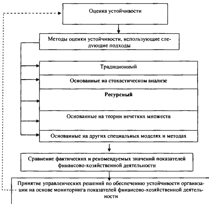
Рис. 1. Схема оценки финансовой устойчивости организации

Традиционный подход отражен в нормативных методиках и использует показатели, характеризующие активы организации, источники их формирования и другие стороны финансово-хозяйственной деятельности, что приводит к многообразию используемых показателей, а отсутствие рекомендаций по их ранжированию затрудняет процесс оценки финансовой устойчивости.