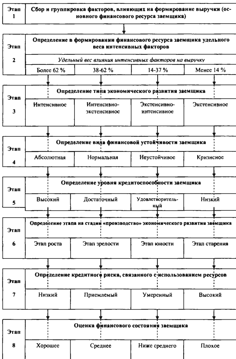
Рис. 3. Этапы методики оценки финансовой устойчивости и кредитоспособности заемщика на основе ресурсного подхода