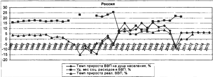
Рис. 2. Динамика темпов прироста реального ВВП, ВВП на душу населения и удельного веса государственных социальных расходов в ВВП в России в 1980–2012 гг. (2011–2012 гг. – прогноз)