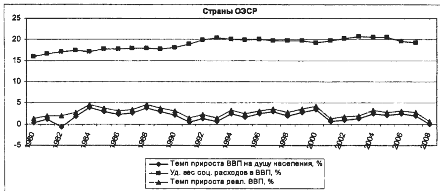
Рис. 1. Динамика темпов прироста реального ВВП, ВВП на душу населения и удельного веса государственных социальных расходов в ВВП стран ОЭСР в 1980–2008 гг.