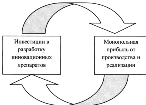
Рис. 1. Модель развития фармацевтической компании

далее (рис. 1). Поэтому, выбрав путь производства дешевой продукции, компании в дальнейшем будет затруднительно аккумулировать и инвестировать достаточное количество средств в НИОКР для осуществления перехода на выпуск инновационных препаратов. С нашей точки зрения, для качественного перехода фармацевтической отрасли на инновационный путь развития, необходимо определить первоначальный источник инвестиций в НИОКР. Далее же, по предложенной циклической модели, компании смогут поддерживать свой инновационный статус самостоятельно.