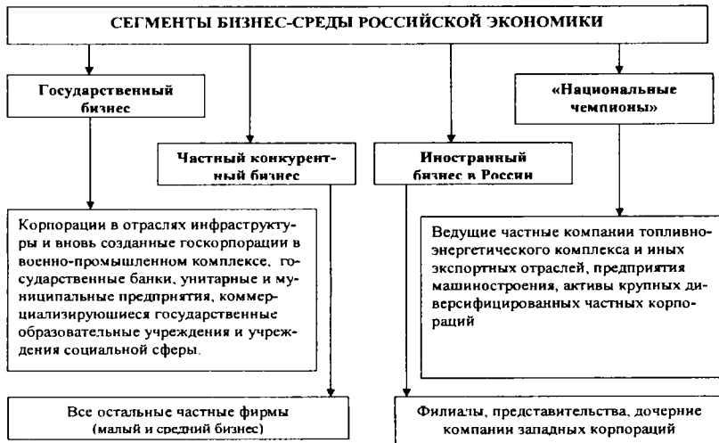
Рис.4. Сегментация народного хозяйства России. 12

В последние годы окончательно оформилось деление народного хозяйства страны на четыре сектора (рис. 4).