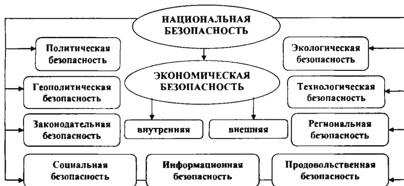
Рис. 2. Место экономической безопасности в системе национальной безопасности государства. 5