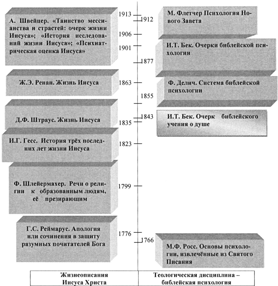
Рисунок 1. Параллельная хронология трудов по библейской психологии и биографическому жанру жизнеописания Иисуса