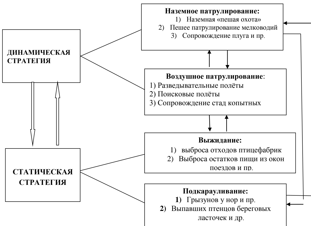
Рисунок 1. Вариант схемы основных поисковых кормовых стратегий ворона, учитывающий мобильность фуражира при поиске корма (из Резанов 2015)

У сороки этот показатель ( \beta_H' = 0.4044 ) выше, чем у грача ( \beta_H' = 0,3981 ) и галки ( \beta_H' = 0,3672 ), но заметно ниже, чем у ворон ( \beta_H' = 0,4920 ) и сойки ( \beta_H' = 0,4226 ). Неравномерность (неупорядоченность) в распределении кормовых методов, ведёт к заметному снижению показателя \beta_H' .