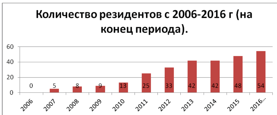
Рис. 1. Рост количества компаний резидентов ОЭЗ «Алабуга» с 2006-2016 гг.

По состоянию на 1 октября 2016 года на территории АО «ОЭЗ ППТ «Алабуга» действуют 22 резидента, 3 резидента находятся на этапе строительства и 23 находятся на «проектной» стадии.