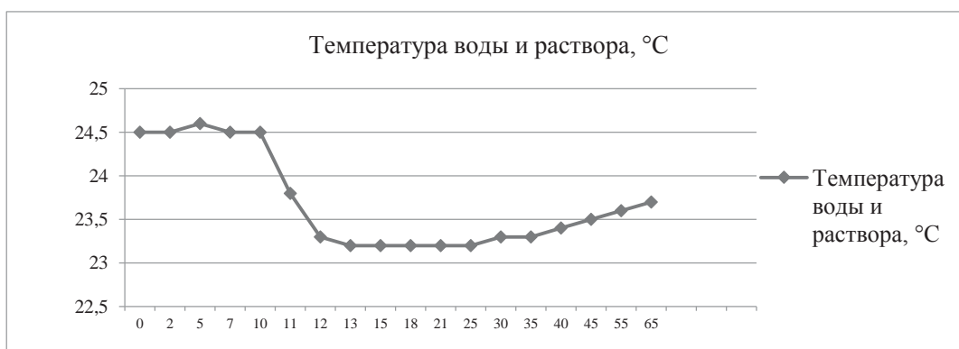
Рис. 2. Зависимость температуры воды и раствора от времени

В исходном состоянии температура воды остаётся неизменной и равной температуре воздуха в комнате: 24,5 °C. Температура воды в процессе растворения в ней поваренной соли уменьшилась в течение 3 минут до 23,2 °C.