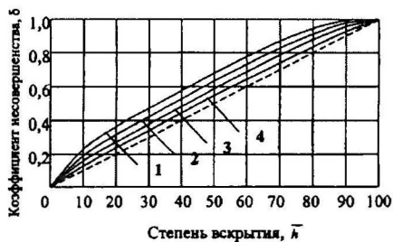
Рисунок 1 - Изменение коэффициента совершенства скважины в зависимости от степени вскрытия: 1 - h=10 м; 2 - h=20 м; 3 - h=30 м; 4 - h=40 м

Как видно из рисунка 1, с увеличением мощности пласта (при h > 20 м) наблюдается почти линейный рост дебита в зависимости от величины вскрытия пласта \bar{h} . При малых мощностях продуктивных пластов ( h < 10 м) связь между дебитом и мощностью вскрытого участка b параболическая.