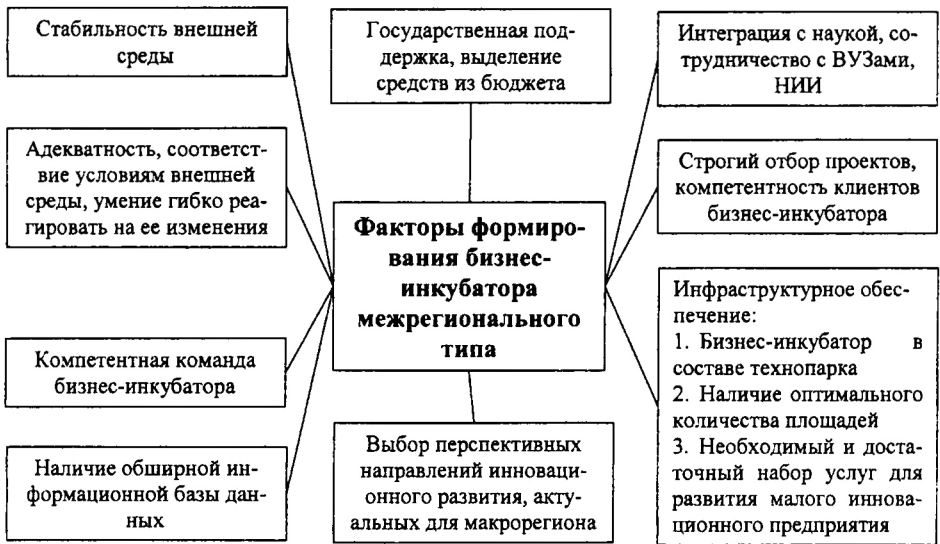
Рис 1. Факторы формирования бизнес-инкубатора межрегионального типа

вационную предпринимательскую среду, адекватную целям и масштабам функционирования макрорегиона.