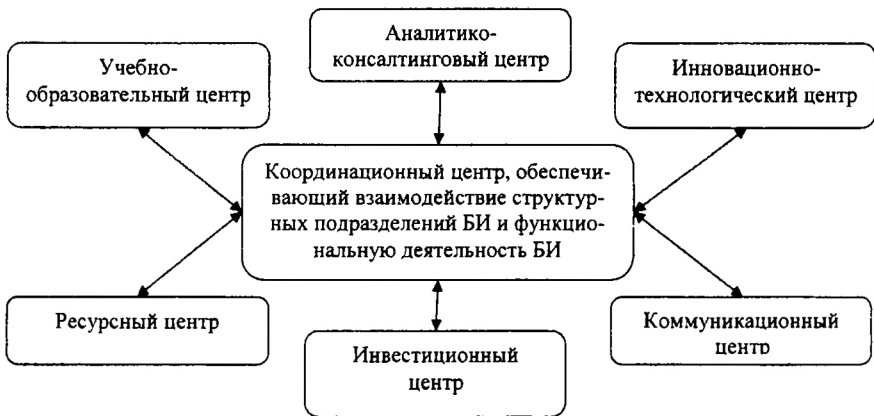
Рис. 2. Структура бизнес-инкубатора межрегионального типа

Функциональная эффективность БИ должна обеспечиваться адекватным структурным делением на отдельные профильные центры по видам инкубационной деятельности. При этом каждый из профильных центров сочетает в себе все элементы транзакционной инфраструктуры выращивания бизнеса: институциональный, организационный и информационный (см. рис. 2).