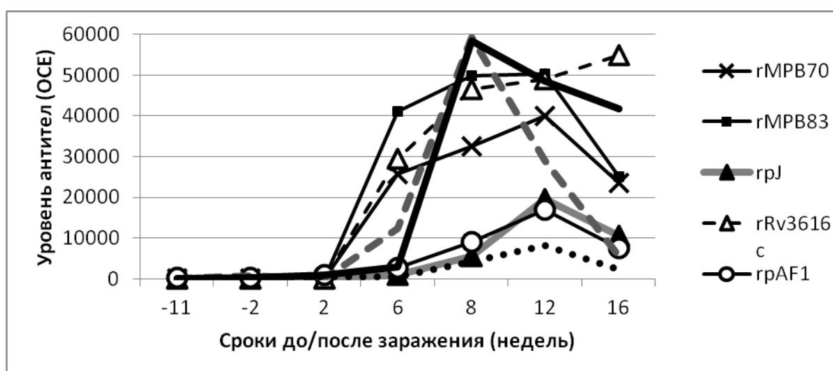
Рис.1. Антителогенез у барсука оаVS2-313.