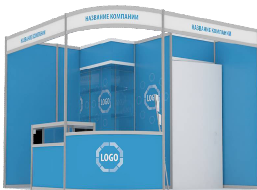
Рисунок 1 – Пример конструкции

Все разработанные конструкции являются типовыми, и изготавливаются из выставочных конструкций «Останогт» (Рисунок 1).