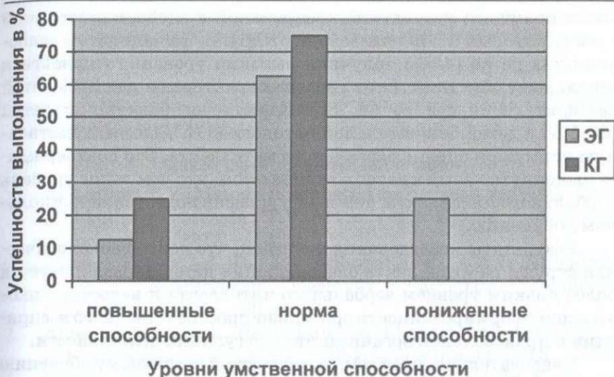
Рис. 3. Уровни развития вербального интеллекта

В группе слабовидящих детей показатели выполнения четырех вербальных субтестов «Осведомленность», «Понятливость», «Арифметика» и «Сходство» достаточно высоки, но несколько ниже, чем у детей контрольной группы и находятся либо в верхних границах нормативных значений, либо на верхней нормативной границе. В то же время низкие показатели выполнения вербальных субтестов «Словарь» и «Повторение цифр» свидетельствуют о недостаточном уровне развития таких структурных компонентов интеллекта как объём актуального словарного запаса и возможности построения развернутого высказывания, кратковременной слухо-речевой оперативной памяти и зрительно-речевой памяти. Достоверность различий отмечена только в субтестах «Осведомленность», «Понятливость» и «Повторение цифр». Несмотря на низкую степень достоверности данных вербальных субтестов слабовидящие дети выполняли эти задания с более низким качеством, чем дети контрольной группы. Одинаково высокие показатели выполнения субтеста «Сходство» скорее свидетельствуют о наученности, так как в основе этого субтеста лежат задания, которые многократно повторяются в течение дошкольного обучения.