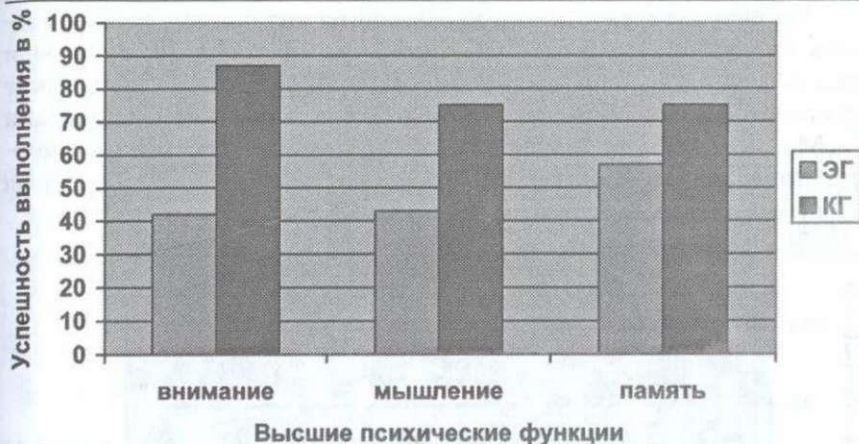
Рис. 1. Уровни развития высших психических функций детей экспериментальной и контрольной групп