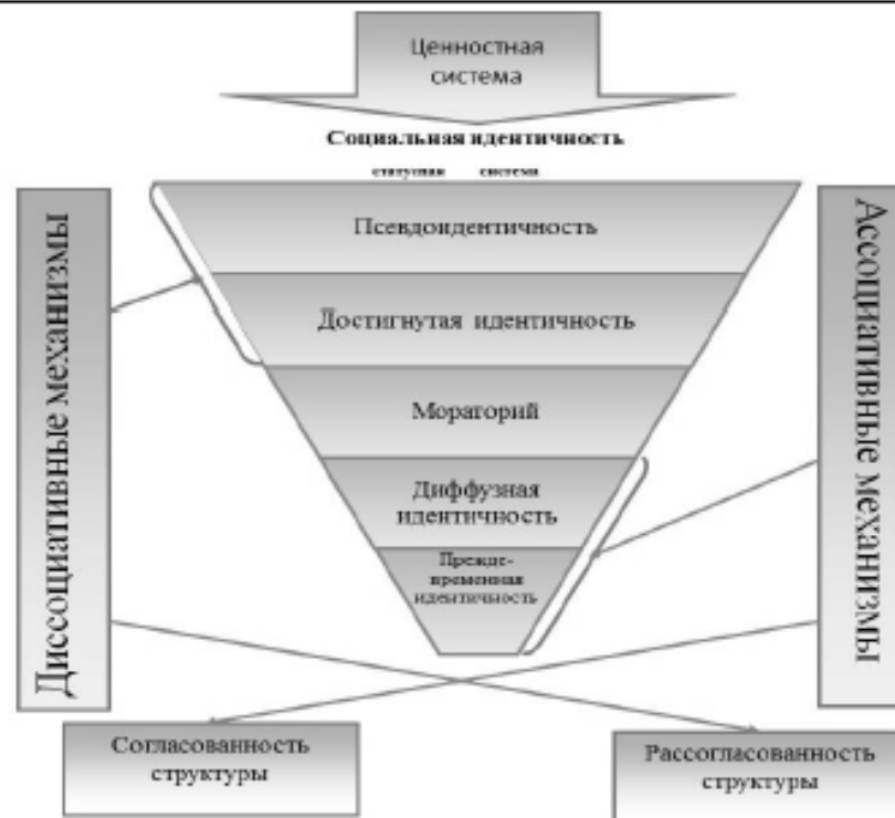
Рис. 1. Концептуальная схема исследования ассоциативно-диссоциативных механизмов регуляции социальной идентичности лиц, находящихся в местах лишения свободы

Диссоциативные механизмы поддерживают рассогласованность структурной организации идентичности, проявляющуюся в отчуждении собственных действий. Отчуждение собственного противоправного деяния приводит к высшим статусам идентичности. Ассоциативные механизмы обеспечивают согласованность структурной организации идентичности, что проявляется в принятии собственных действий и приводит в данном варианте к развитию делинквентной идентичности.