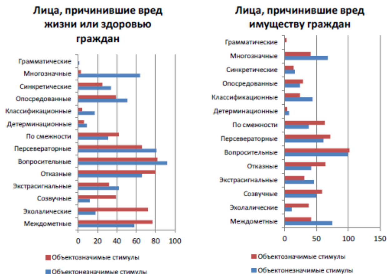
Рис. 3. Профиль ассоциативных реакций на объектозначимые и объектонезначимые стимулы у лиц, причинивших вред имуществу граждан, и лиц, причинивших вред жизни или здоровью граждан

В результате исследования ассоциативных реакций у лиц, причинивших вред жизни или здоровью граждан, на объектозначимые стимулы выявлено преобладание персевераторных, эхолических, отказных, междометных, вопросительных ассоциативных реакций при минимальной представленности или отсутствии классификационных, детерминационных, многозначных и грамматических ассоциативных реакций (рис. 3).