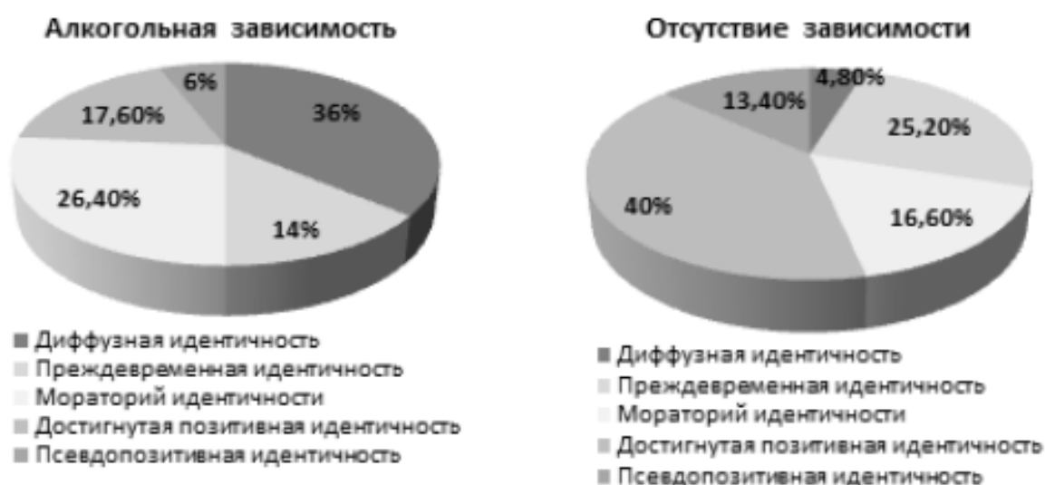
Рис. 3. Статусная система личностной идентичности при отсутствии наркотической зависимости.

самооценкой, приводящей к сомнениям в своей способности что-то изменить или предпринять (рис. 2).