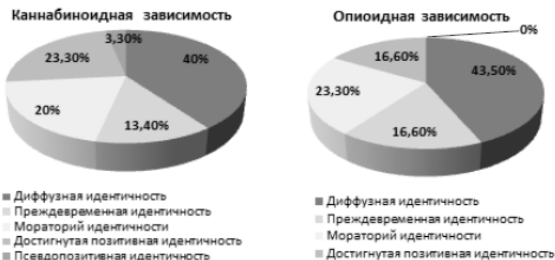
Рис. 2. Статусная система личностной идентичности при наркотической зависимости.