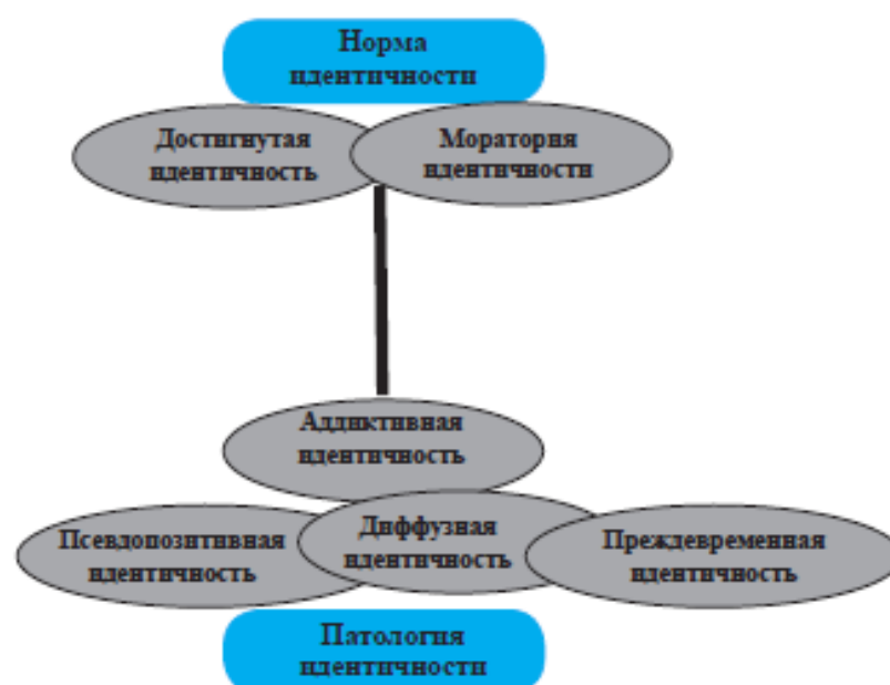
Рис. 1. Распределение статусной системы идентичности в континууме «позитивная идентичность – негативная идентичность».

Совмещая две исследовательские позиции (Л.Б. Шнейдер [25, 26] и Н.В. Дмитриевой [6, 8]), представим схему, отражающую распределение статусной системы идентичности в континууме «позитивная идентичность — негативная идентичность». Аддиктивная идентичность генерирует проявления статусов негативной трансформации. В качестве базисной основы негативной трансформации идентичности выступает диффузная идентичность. Статус моратория идентичности, характеризующий кризисы идентичности, указывает на сохранный ресурс (рис. 1).