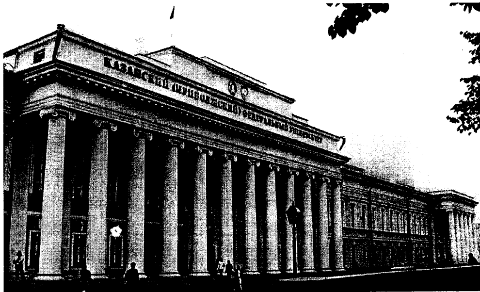
Казанский (Приволжский) федеральный университет

В процессе электронного обучения используется целый комплекс элементов, который может