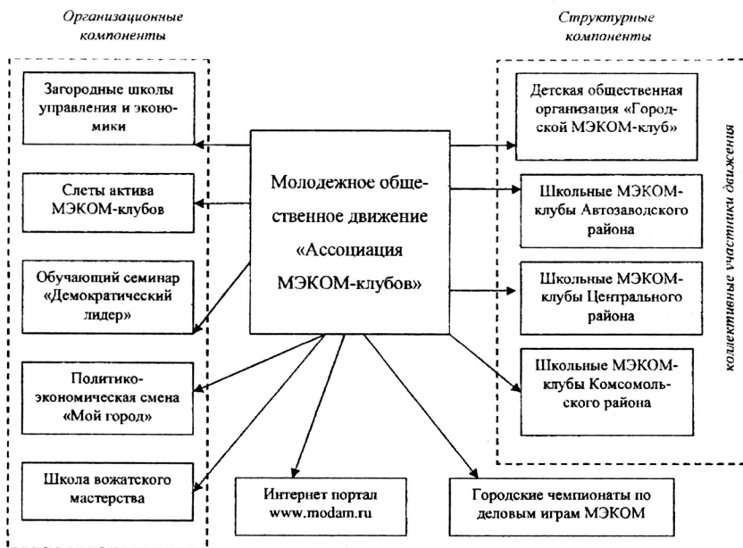
Рис. 2. Структура и основные направления деятельности Ассоциации МЭКОМ-клубов как учебно-педагогической среды по развитию профессионального самоопределения учащейся молодежи

Реализация модели происходит в виде деятельности «Ассоциации МЭКОМ-клубов» в определенной педагогической среде (см. рис. 2).