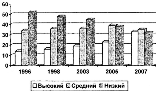
Рис. 3. Динамика средних уровней профессионального самоопределения учащихся по 6 критериальным показателям

В заключении даны основные результаты экспериментальной работы.