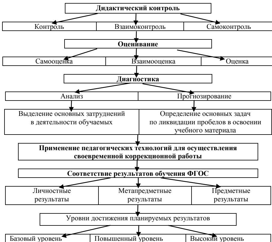
Рис. 1 Компоненты дидактической контрольно-оценочной системы

технологий для проведения своевременной коррекционной работы по ликвидации пробелов в освоении изучаемого материала представляют собой взаимосвязанную систему, способствующую повышению личностных, предметных и метапредметных результатов освоения основной образовательной программы учащимися 5–6-х классов согласно ФГОС. Созданная модель отражает целостный, системный подход к включению в контрольно-оценочную деятельность как учителей, так и учащихся: ее эффективность повышается в условиях лично-деятельностного подхода, когда все учащиеся включены в контрольно-оценочную и своевременную коррекционную деятельность в рамках бинарного подхода, способствующего усилению функций самости: самоконтроля, самооценки, самодиагностики, самокоррекции со стороны учащихся (Рисунок 1, Рисунок 2).