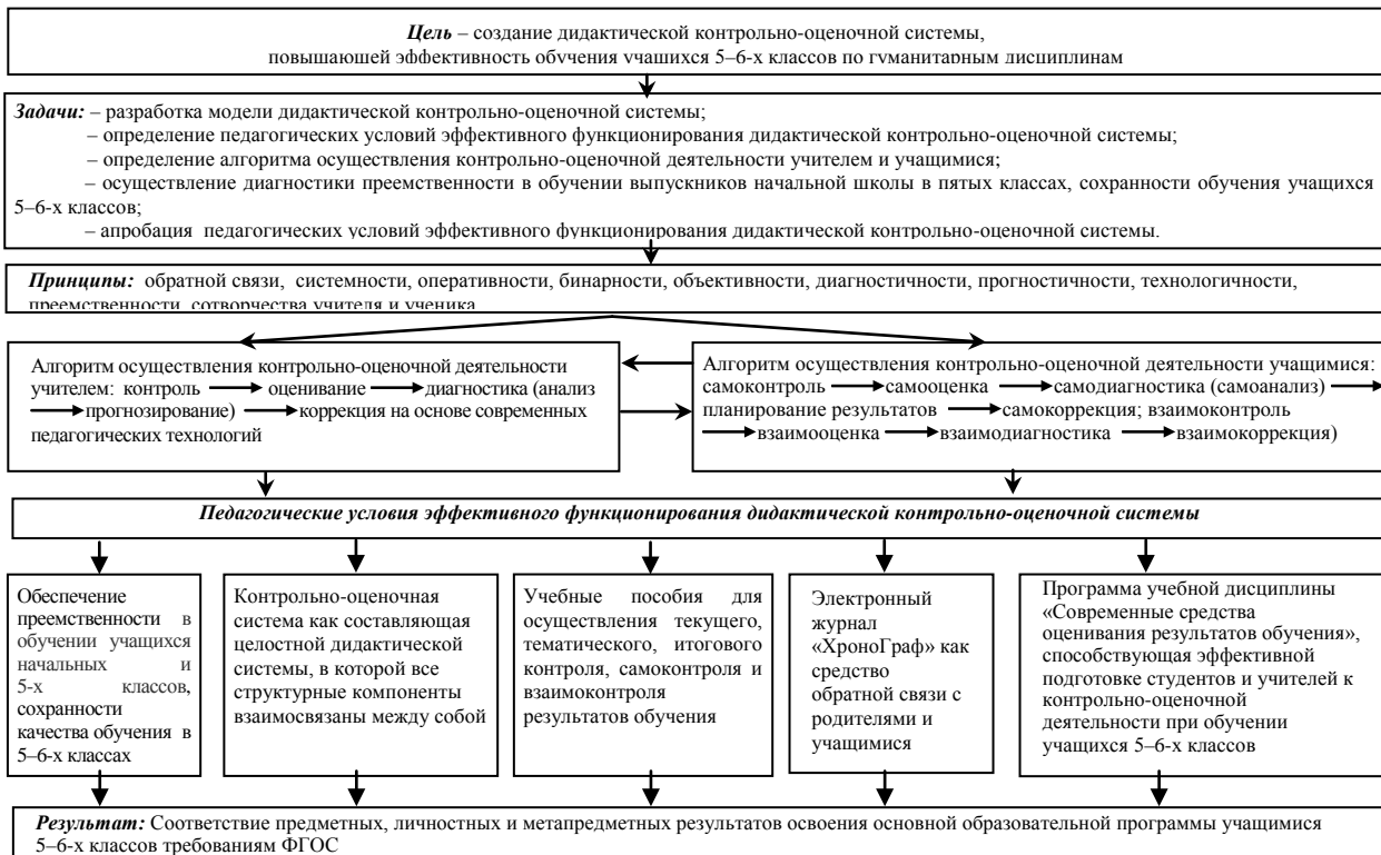
Рис. 2 Модель дидактической контрольно-оценочной системы, способствующая повышению эффективности обучения учащихся 5–6-х классов