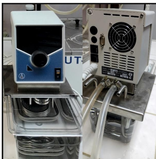
Рис. 4. Термостат жидкостный циркуляционный LOIP LT-105P

Оставшиеся на стенках холодильника капли воды сталкивают или смывают растворителем в ловушку. Измеряется количество воды в ловушке и рассчитывается объемная ( X ) доля воды в % по формуле (1):