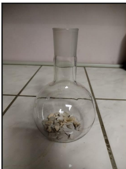
Рис. 2. Кипелки – осколки фарфора для обеспечения равномерного кипения.

Реакционная колба нагревается. Кипелки (рис.2) с внутренней стороны помогают спокойно образовывать пузырьки пара, содержащего реакционный растворитель, и компонент, который должен быть удален. Эти пары проходят из реакционной колбы вверх через холодильник, и конденсированная вода капает в ловушку дистилляции. Здесь несмешивающиеся жидкости разделяются на слои (вода внизу и растворитель над ней). Когда их комбинированный объем достигнет уровня бокового отвода, верхний (менее плотный) слой стекает обратно в реактор, в то время как слой воды останется в ловушке. Процесс испарения, конденсации и сбора продолжается до постоянного уровня воды [1,3].