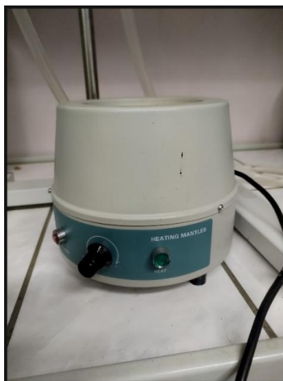
Рис. 3. Колбонагреватель 250 Вт в корпусе из нержавеющей стали со встроенным электронным регулятором мощности