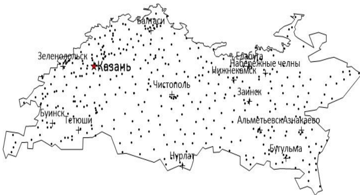
Рисунок 1 – Карта- схема точек отбора проб на территории Республики Татарстан

квартования для создания одного объединенного образца объемом 1 л. В качестве инвентаря использовались стандартные металлические кольца высотой 50–200 мм и диаметром 140мм или лопата. Координаты каждой точки отбора проб фиксировались с помощью GPS-навигатора. После транспортирования в лабораторию пробы подготавливались к анализу. Для этого они просушивались при комнатной температуре до воздушно - сухого состояния и просеивались для получения гомогенной массы. Из отобранных проб изготавливались счетные образцы, объемом 1 л. На рисунке 1 представлена карта-схема точек отбора проб почвы на территории Республики Татарстан.