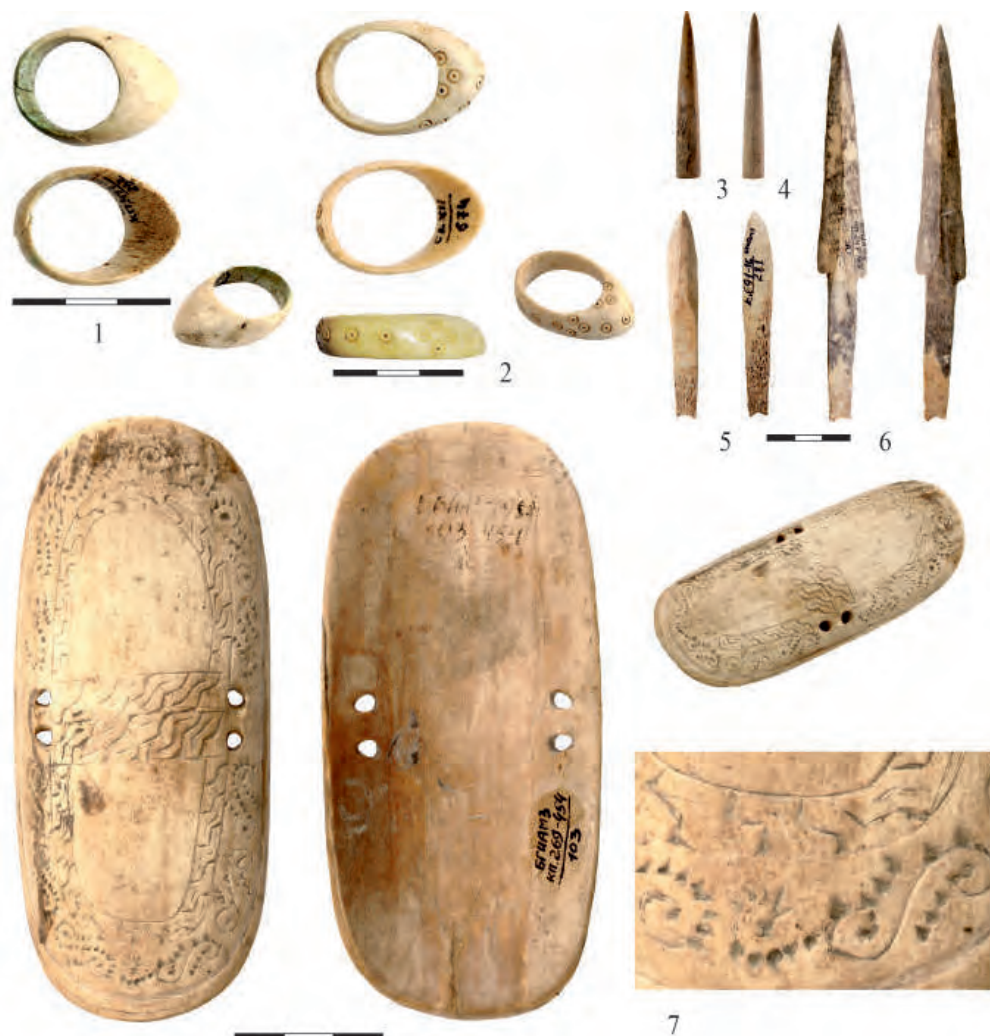
Рис. 5. 1–2 – втульчатые наконечники стрел; 3–4 – черешковые наконечники стрел; 5–6 – кольца для стрельбы из лука; 7 – щиток для защиты запястья при стрельбе из лука (по Баранов и др., 2016 а)