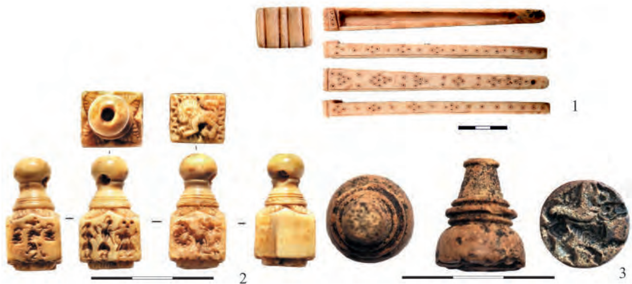
Рис. 4. 1 – пенал для калама (по: Баранов и др., 2016 б); 2–3 – костяные печати-матрицы шахматовидной формы (по: Бадеев, Яворская, 2017)