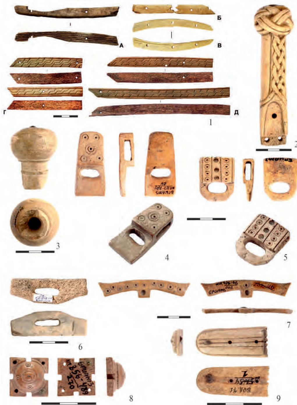
Рис. 6. 1 (А–Д) – седельные канты (накладки) (по: Яворская, Бадеев, 2019); 2 – рукоятка плети; 3 – удила; 4–5 – обоймы с петлей; 6 – застежка недоуздка (по: Баранов и др., 2016 а); 7 – застежка для недоуздка; 8 – накладка поясная, 9 – наконечник ремня (по: Баранов и др., 2016б)

ности преобладают рукоятки и их детали (рис. 2). Из кости и рога изготавливался широкий ассортимент кожевенных и ткацких орудий труда (рис. 3), письменные принадлежности (рис. 4: 1), а также такие статусные вещи, как печати (рис. 4: 2–3). На охоте и в военном деле кость и рог использовались в основном для оснащения лучников (рис. 5); в снаряжении лошади – как детали креплений и реже в качестве украшений; для об-