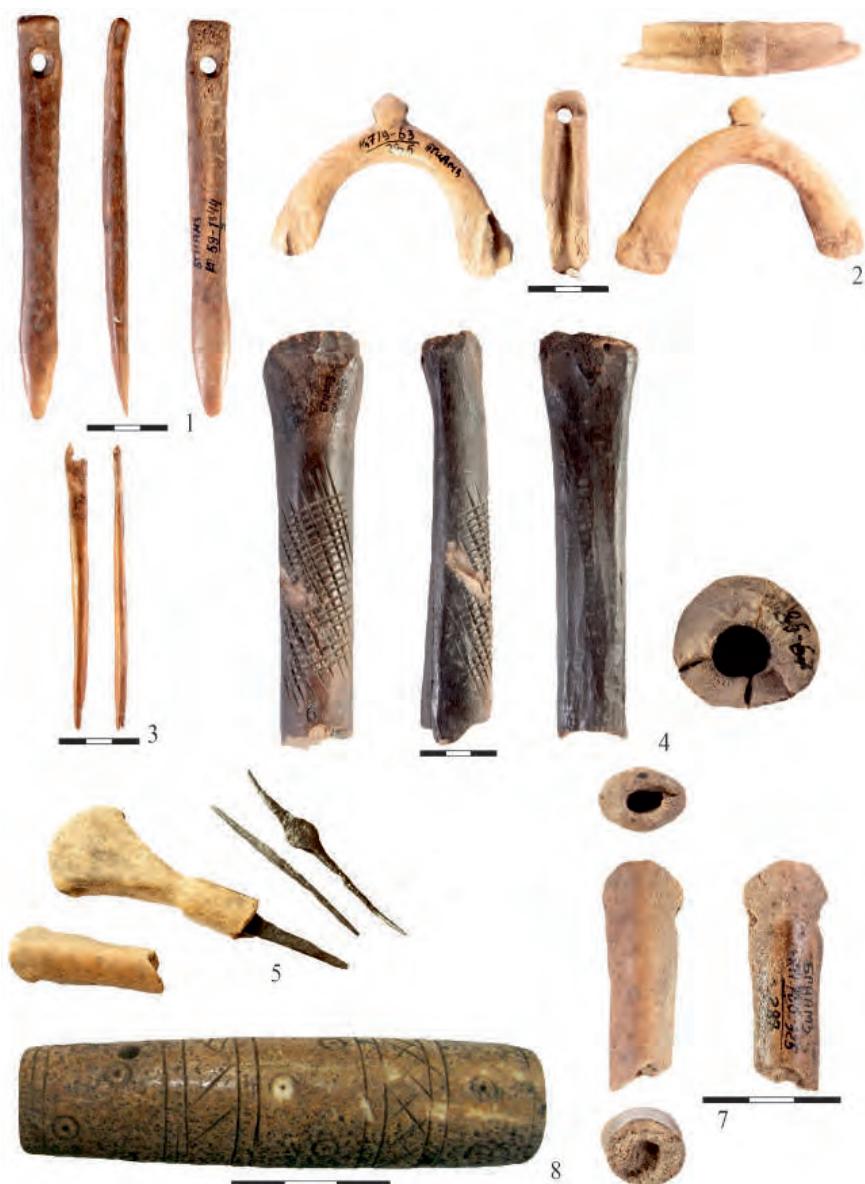
Рис. 3. 1 – кочедык; 2 – блок ремизки ткацкого станка; 3 – игла (по: Баранов и др., 2016 а); 4 – инструмент для тиснения кожи; 5 – шило с костяной рукоятью; 7 – рукоять шила (по Баранов и др., 2016 б); 8 – игольник (Сивицкий и др., 2015)

2, 4.35–75, 7.2.35–38, 7.2.172–173, 7.3.34, 7.3.38, 7.3.43–47, 7.3.49–50, 7.3.57, 7.3.59–66, 9.3–9, 12.8 (Баранов и др., 2016а) и № 17.8, 22.6.1–10, 22.6.14–17, 22.6.18–22, 22.6.25–30, 22.6.35–36, 22.6.39, 22.7.10–12, 22.7.15 (Баранов и др., 2016б).