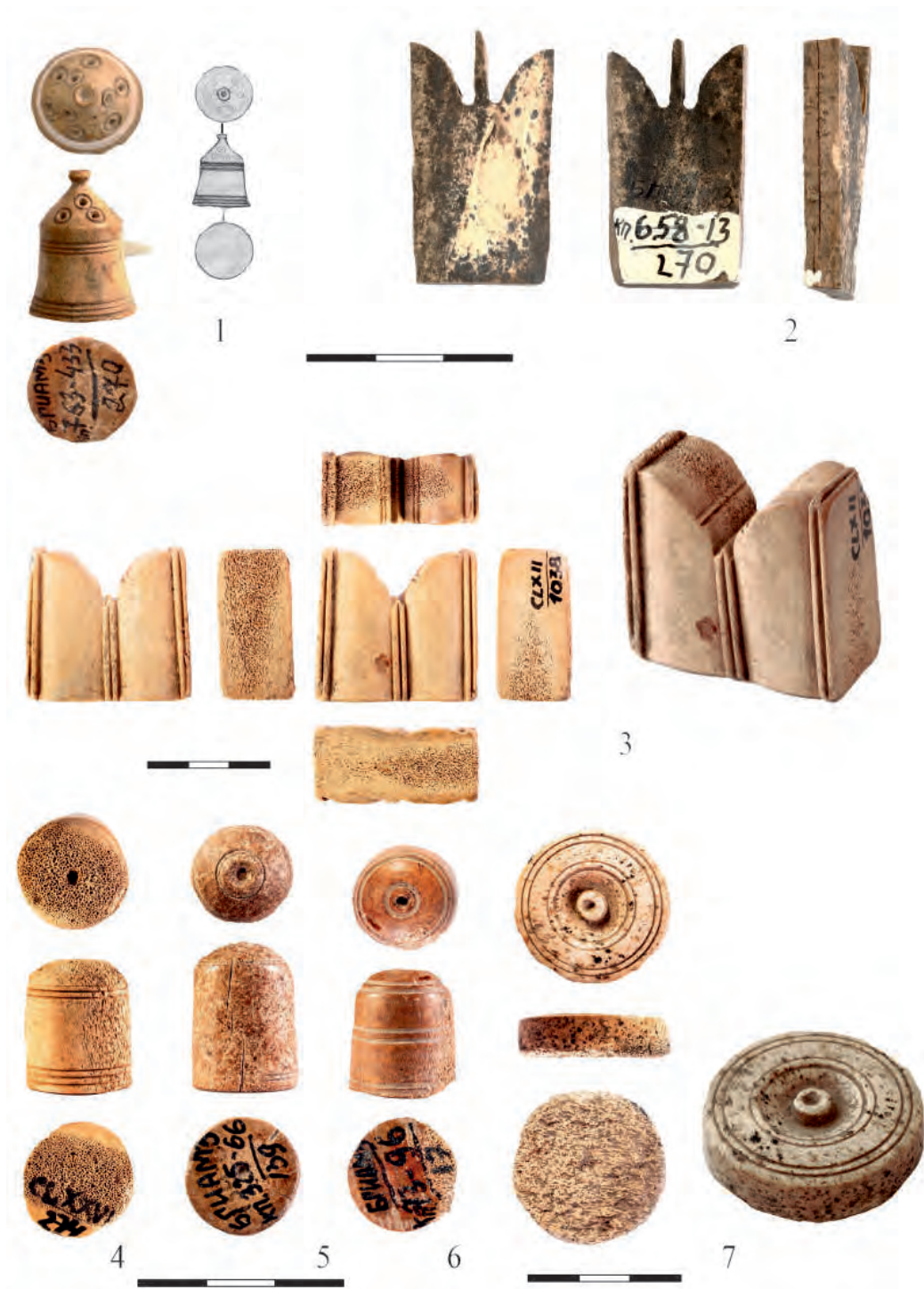
Рис. 8. 1 – шахматная фигура – пешка, 2–3 – шахматные фигуры – ладья, 4–6 – шахматные фигуры – пешка; 7 – шашка (по: Баранов и др., 2016 а)

наментированные обоймы от ремней, поясные накладки, печати. К предметам вооружения, типичным именно для золотоордынского периода, относятся также кольца лучников, концевые вкладыши на лук и орнаментированные накладки на колчан.