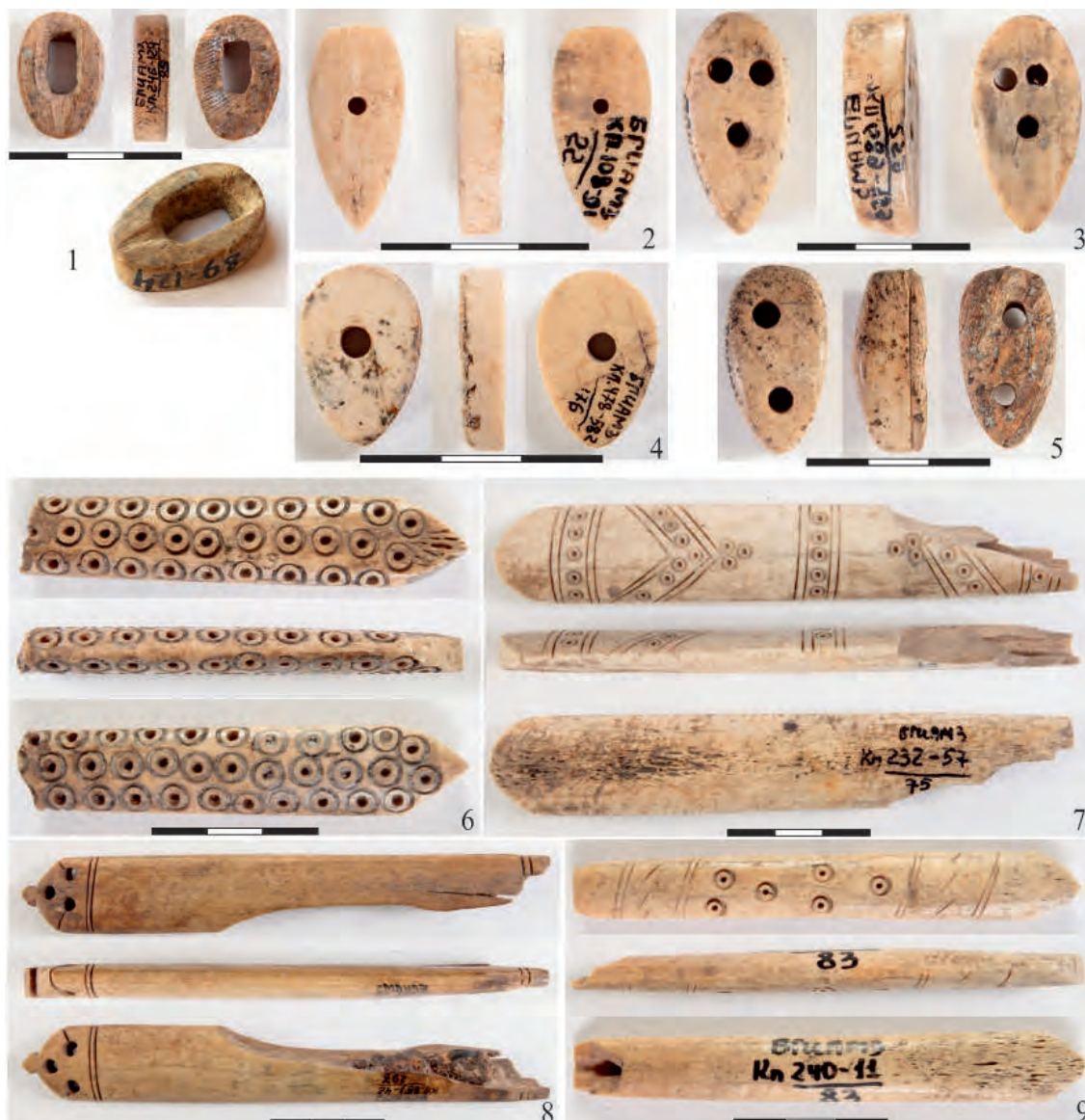
Рис.2. 1 – муфта рукояти ножа; 2–4 – затыльники рукоятей ножей; 5–9 – рукояти ножей (по Баранов и др., 2016б)

публикации материалов городов, существовавших только в золотоордынское время (Федоров-Давыдов, 1994, с. 174–179; Масловский, 2007; Недашковский, Моржерин, 2020).