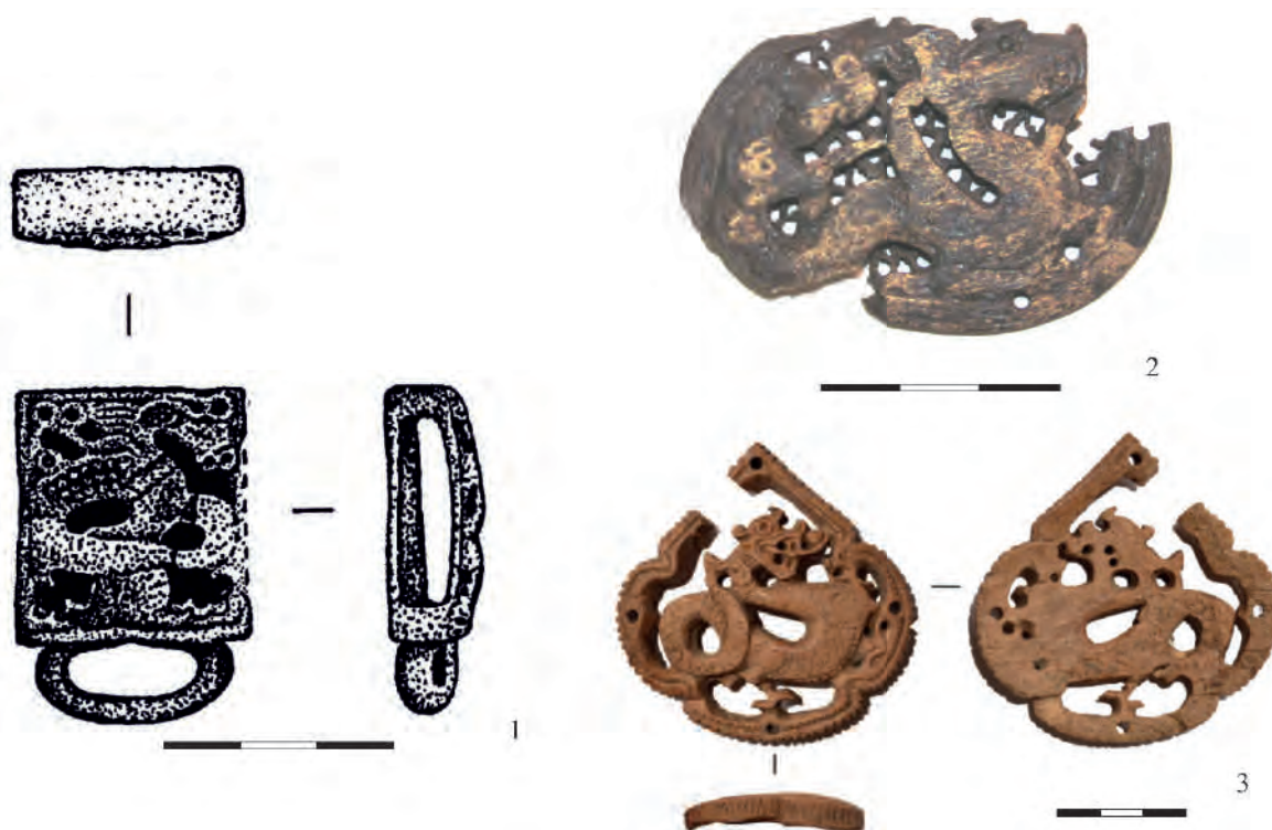
Рис. 1. Изделия с изображением дракона, прорезная техника. 1 – поясная обойма, Билярское селище III (по Валиулина, 2002); 2 – накладка, Болгар (по Сивицкий и др., 2015); 3 – накладка, Маджар (Обухов, Бочаров, 2018)

и рога почти не отличаются от деревообрабатывающих инструментов. Поскольку деревянные вещи сохраняются чаще всего значительно хуже, чем костяные, при изучении костяных изделий можно пополнить сведения о технике резьбы в целом. Таким образом, кость может служить дополнительным источником для изучения других видов деятельности: скотоводства, охоты, кожевенного и деревообрабатывающего производств.