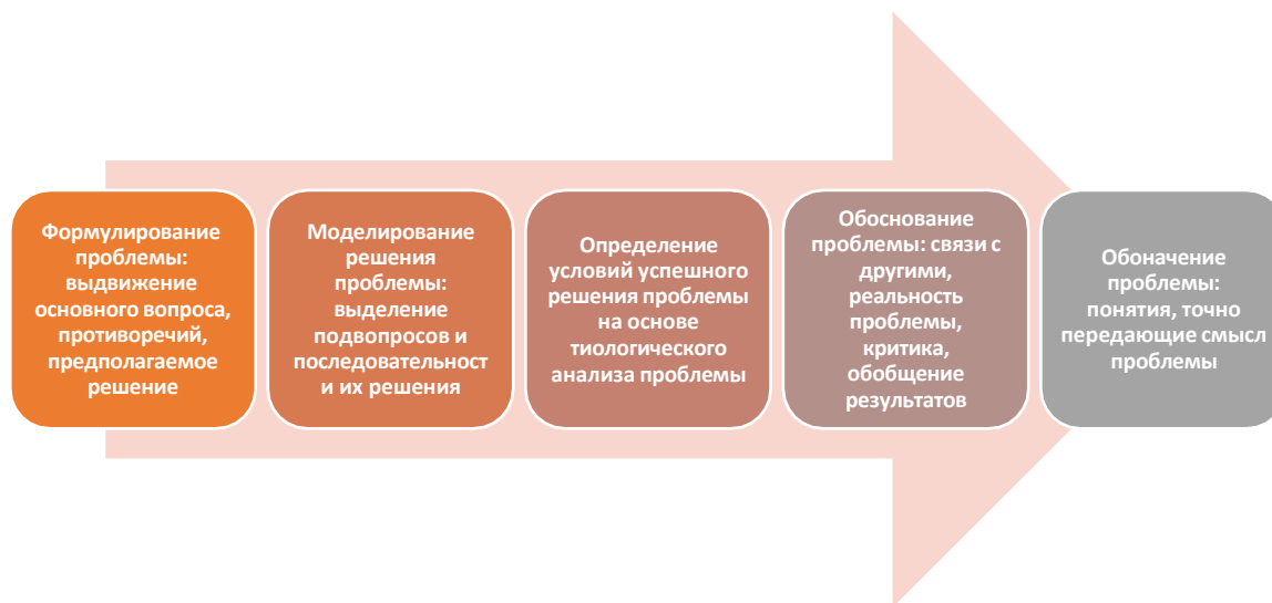
Рис. 2. Модель постановки проблемы

становки проблемы, нами была построена модель этого процесса (рис. 2):