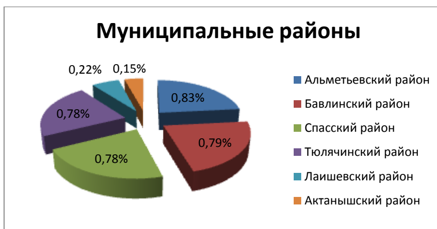
Рисунок 1 - Уровень безработицы в муниципальных районах Республики Татарстан

Среди муниципальных районов Республики Татарстан самый высокий уровень безработицы рассматривается в Альметьевском районе, что составляет 0,83 %, самый низкий уровень в Актанышском районе 0,15 %.